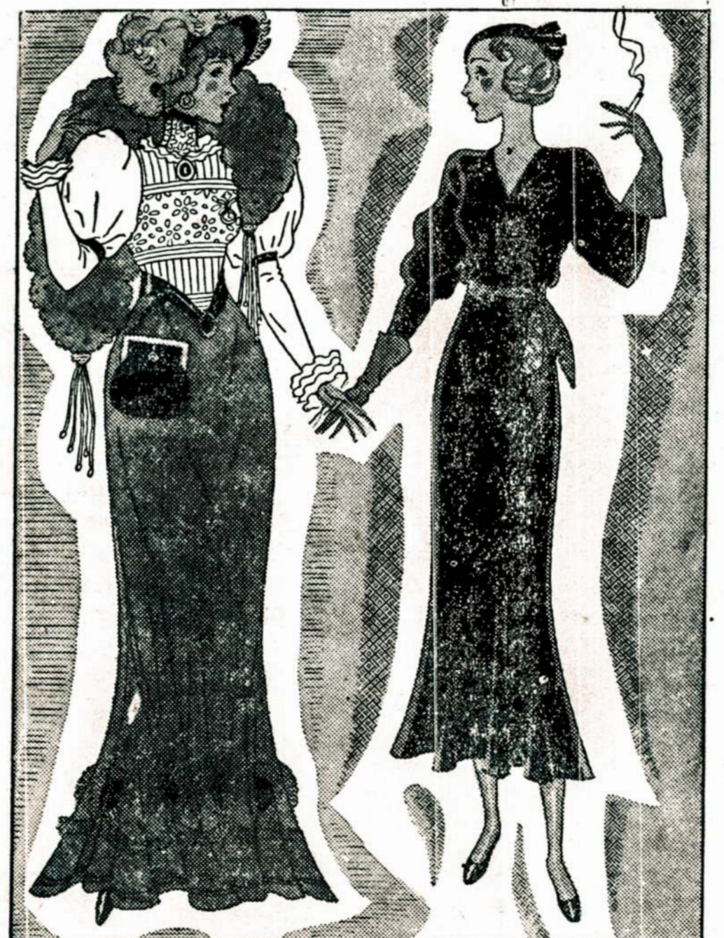
19-to šimtmečio pabaigos ir 1932 metų mados

Kurt H. Schurig & Co., 50 Broadway, New York.