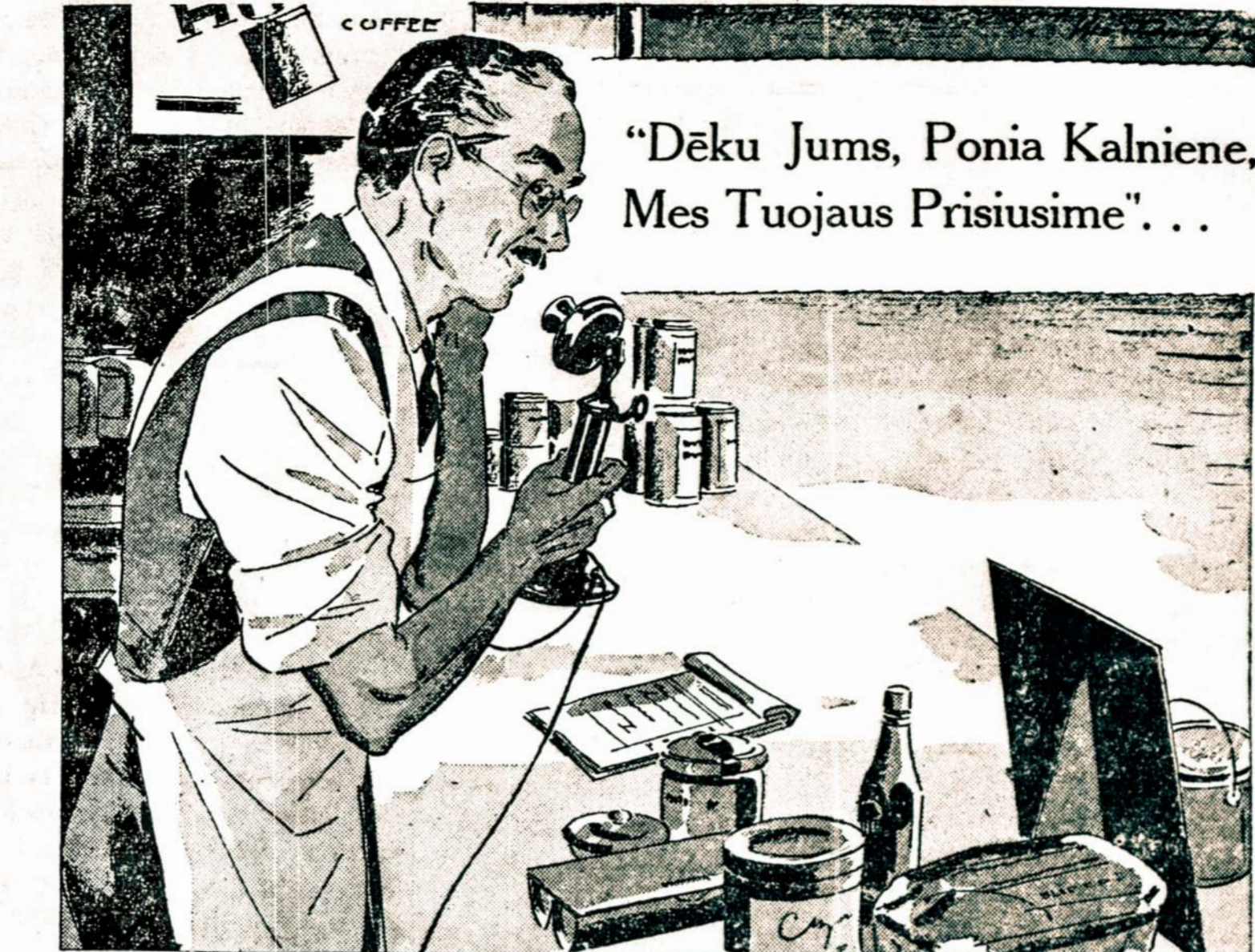
„Dėku Jums, Ponia Kalniene, Mes Tuojaus Prisiusime“...

Kaip šis madų palyginimas parodo, pilno ilgio rankovė yra pripildyta kvoduotos medžiagos, kaip ir kito užvardinimo rankovė. Viktorijos laiku panelė, devyniolikto šimtmečio pabaigoje, didžiavosi su savo kumpine „leg o'utton“ rankove, o ši rudenį panelė Amerika atsiduos „dolan“ rankovei, kuri išskiriu yra nepilna, bet vis anganti balioninė rankovė.