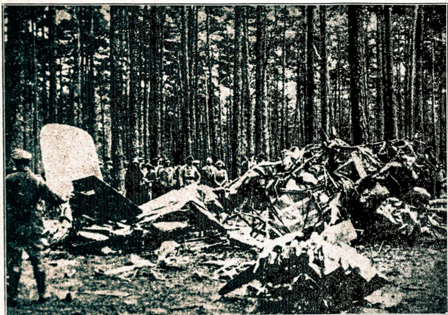
Šiame paveiksle matome lėktuvo „Lituanica“ liekanas. Šis lėktuvas sudužo Vokietijos miške 17 d. liepos anksti ryte ir jam puolant žemyn užsimušė mūsų lakunai, kap. S. Darius ir leit. S. Girėnas, kurie skrido iš New Yorko į Kauną.