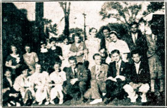
Grupė jaunuolių, dalyvavusių SLA. Ketvirto Apšvietimo jaunuolių suvažiavime, kuris neseniai įvyko Bridgeport, Conn.