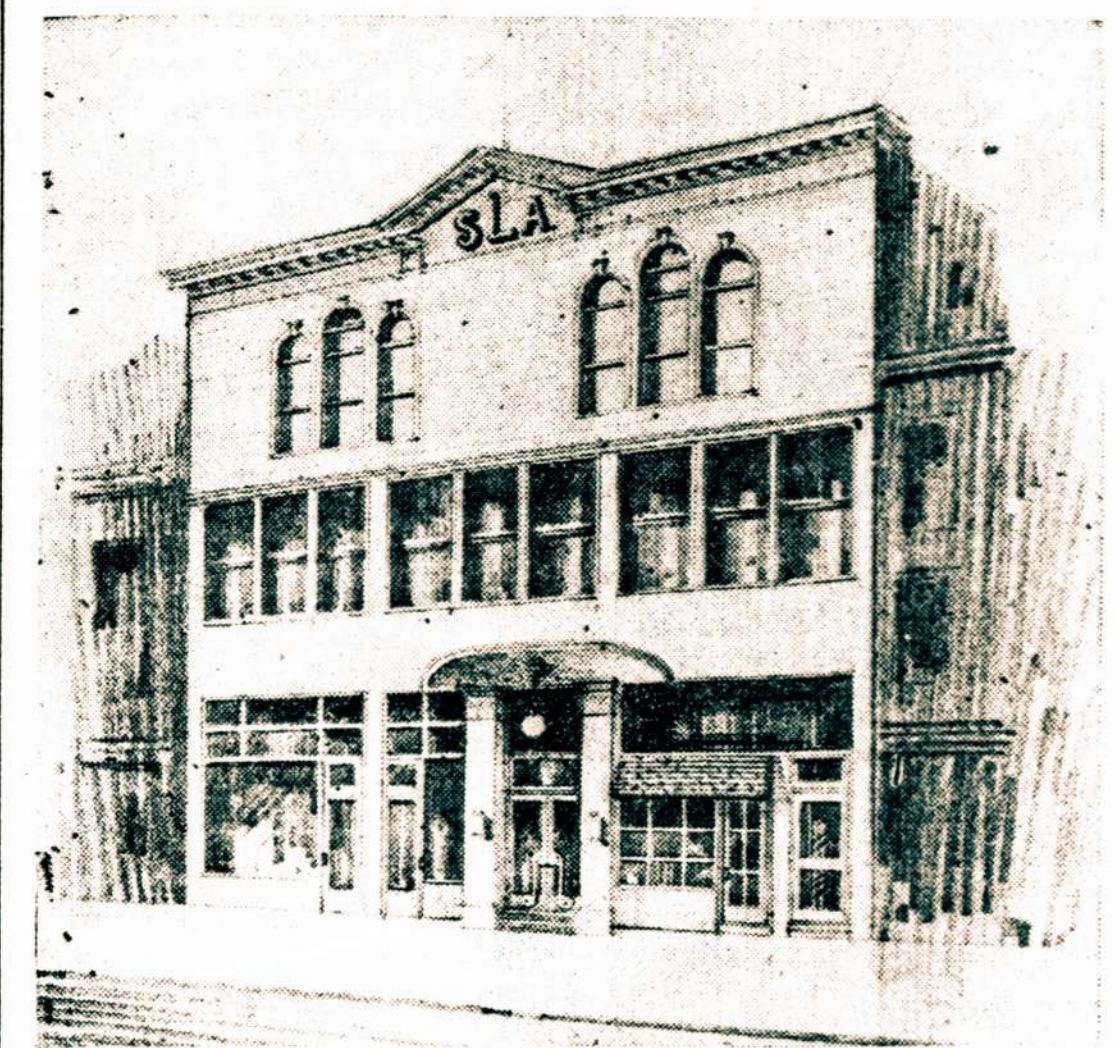
SIS ARCHITEKTO PIESINYS PARODO KAIK ATRODYŠ DABAR PERTAISOMAS BUVĖS „VIENYBĖS“ NAMAS.

New Yorko ir Brooklyno apylinkės lietuvių ir SLA. kuopos netrukus susilauks puošnią ir patogią vietą savo įvairiems viešioms ir privatiems parengimams ir susirinkimams. Buvęs „Vienybės“ namas, kurį Susivienijimas paėmė forklozavimo procesu ir kurio negalima buvo su naudą Susivienijimui išnuomoti, dabar yra plačiai remontuojamas ir pertaisomas į patogias tris krautuves, dvi sales ir du augštus, kurie tiks by kokiam prekybos, pramonės ar išdirbystės tikslui.