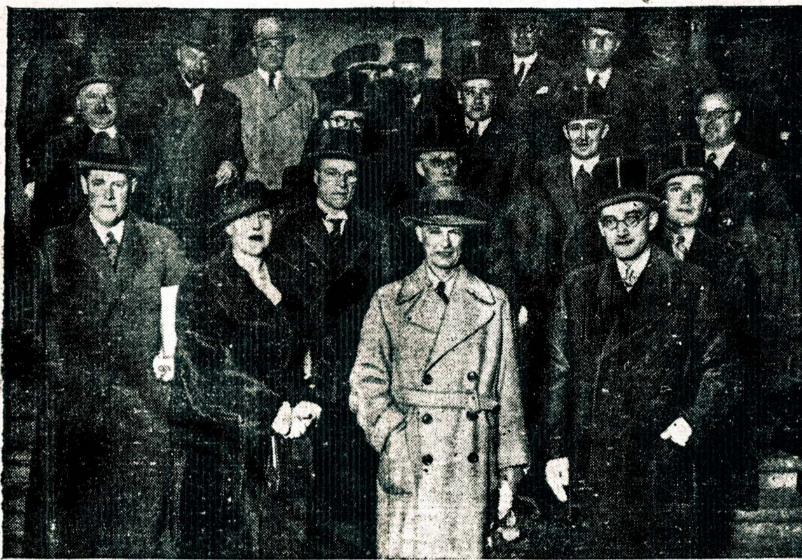
Švedijos užsienų reikalų ministerio Sandlerio sutikimas Kauno stoty. Pirmoje eilėje vidury stovi ministeris Sandleris, dešinėje — užsienų reikalų ministeris St. Lozoraitis.

Jūdvių ieškojimas Jungtinių Valstijų valdžiai kainavo apie 4,000,000 dolerių.