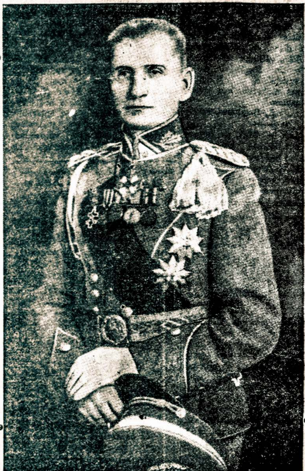
Divizijos generolas Leonas Žukauskas, buvęs kelis kartus Lietuvos kariuomenės vadu, šiemet mini 50 metų, kaip eina garbingas karininko pareigas.