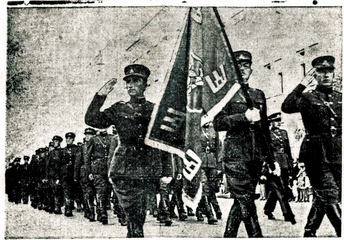
Lietuvos Šaulių Sąjungos 18 metų sukaktuvių parengime birželio 24 d. šauliai žygiuoja pro Nežinomojo Kareivio Kapą.

WASHINGTON, D. C., liepos 31. — Jungt. Valstijų Army Air Corps nusipirko vieną didžiausių ir smarkiausių kariskų lėktuvų. Šį lėktuvą operuoja penki kareiviai. Jame yra šeši kulkosvaizdžiai ir jis gali nešti bombas. Taipgi jis gali iškelti 300 mylių per valandą ir kovoti 30,000 pėdų aukštumoje. Tikima, kad tai greičiausioji pasaulyje karinė oro mašina, kuri bus naudojama kovoti bombanešius.