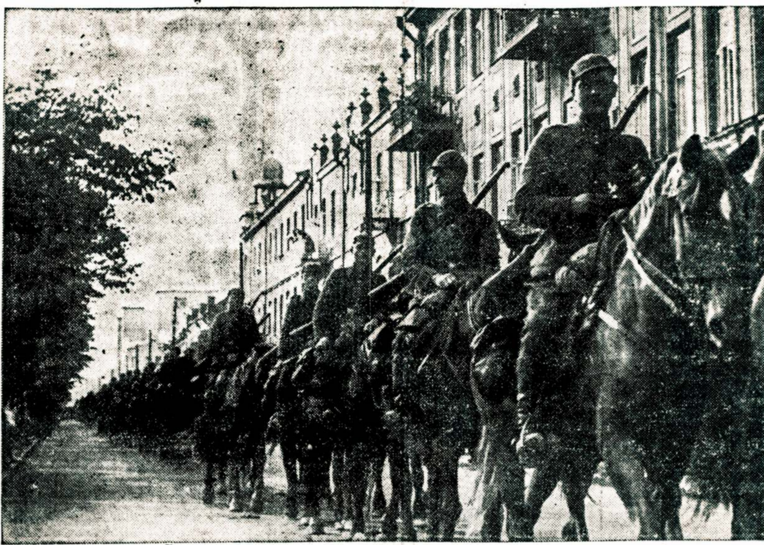
Šaunieji Lietuvos kariuomenės gusarai, sugrįžę iš šio rudens manevrų, mergelių gėlėmis apkaisti joja laikinosios Lietuvos sostinės Kauno gatvėmis.

FRESNO, CAL. — Valst. kolegijos Frenzoje geologai atkasė liekanas dviejų mižiniškų senovės diriečių, kurie, geologų apskaičiavimu, gyvenė prieš 50,000 metų. Vieno iš atkastųjų skeletonų ilgis esąs 30 pėdų.