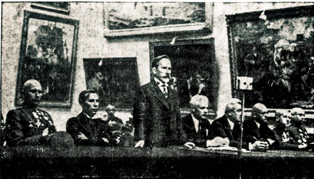
Lietuvių Karių Rusijoje sąjūdžio dalyvių suvažiavimo iškilmingame posėdyje kalba Lietuvos prezidentas Antanas Smetona.

Lietuvoje draudimo nuo nelaimingų atsitikimų kasa per šį metų 8 mėn. audraustiesiems išmokėjo 97,394.58 lt. pašelpų ir 48,635.30 lt. pensijų, viso 146,029.88 lt. Daugiausia nelaimingų atsitikimų pasitaiko medžio pramonėje, apie 25 nuoš. Iš šios srities darbuočių daugiausia nelaimių įvyksta lentgiūviuose ir baldų dirbtuvėse — 10 nuoš., miško medžiaga vežant arkliais — 8 nuoš. ir statybių miska kertant — 7 nuoš.