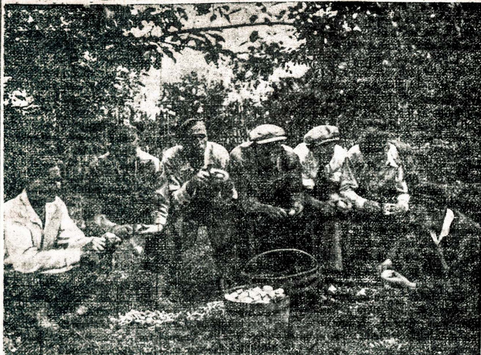
Vilniaus universiteto lietuviai studentai ekskursiją po Okupuotąją Vilniją metu patys gaminasi pietus. Jie jau prie visko pripratę, grūdinais busimoms kovoms už Lietuvos žemę. Dabar šios lietuvių studentų kepuraitės uždraustos nešioti.

Italija ir Vokietija, neturėdamos aukso ir kolonijų, barškina ginklais ir daro sutartis savo nenaudai. (II. P.)