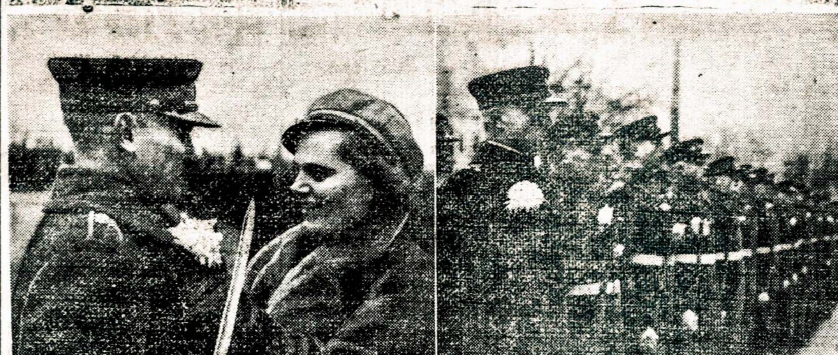
Pirmojo Lietuvos Prezidento Karo mokyklos auklėtiniai, kuriems per Kariuomenės šventę, lapkričio 23 d. Vytauto Didžiojo Universiteto studentai nupirko ir padovanojo šautuvus. Be to, studentės papuošė juos gėlėmis. Kairėje studentė sega kariuoni gėlę.

KAUNAS. — Susisiekimo ministerija parengė projektą atidaryti garlaivių susisiekimą Neriu iki administracijos linijos.