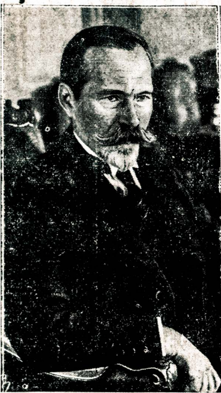
ANTANAS SMETONA. Pirmasis ir dabartinis Lietuvos Valstybės prezidentas.