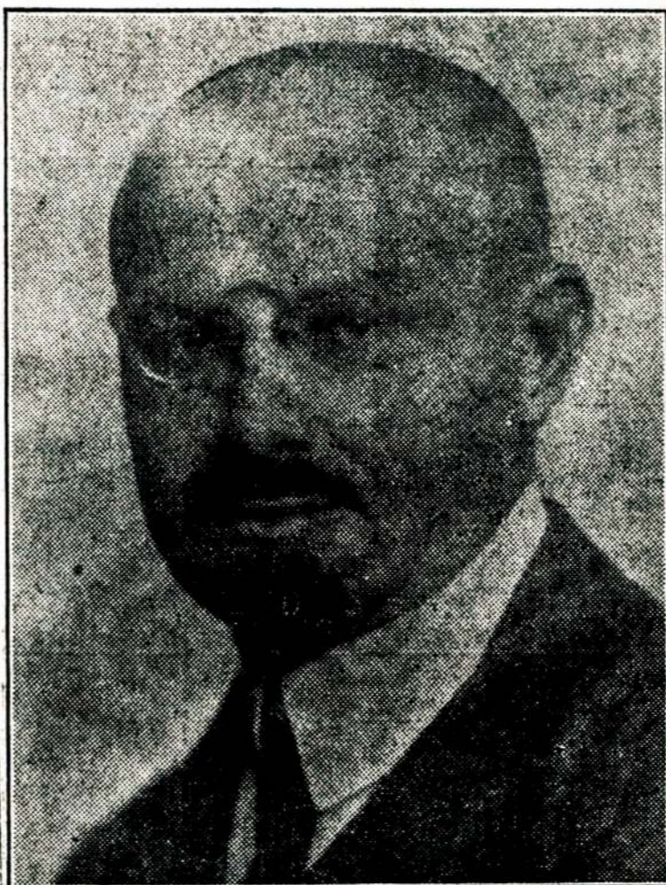
ALEKSANDRAS STULGINSKIS. Buvusis Lietuvos Prezidentas.