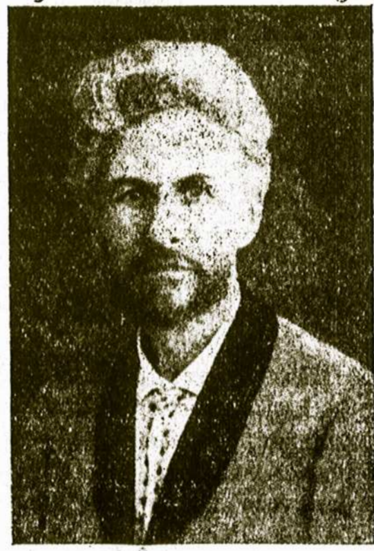
Vydukas (Vilius Storasta), Nemuno kranto saugotojas, žymus rašytojas ir filosofas.

Šių metų kovo 22 dieną garsiam rašytojui ir veikėjui Vydunei sukanka 80 metų amžiaus. Vydukas tėra jo slapyvardė; tikroji pavardė — Vilius Storasta. Jis gimė Mažojoje Lietuvoje — Jonaičių sodžiuje, Šilutės apskrityje.