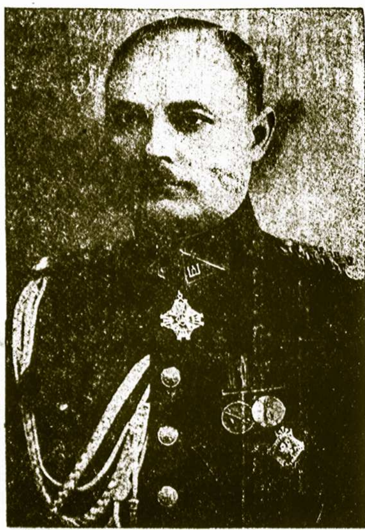
Gen. Jonas Cernius

Šiame Motery Vieniybės parengime matėsi daug jaunimo ir senesnio amžiaus žmonių. Motery rėmėjų, draugų ir biznierių — visi jie buvo geroje nuotaikoje ir smagiai pasižokė prie geros muzikos. Koresp.