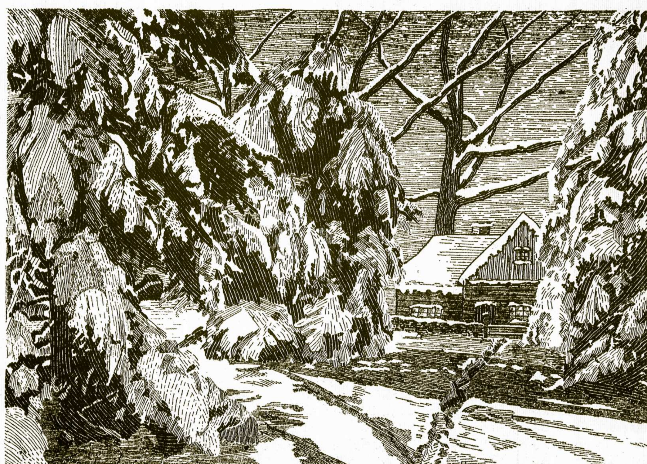
Winter scene - Purera