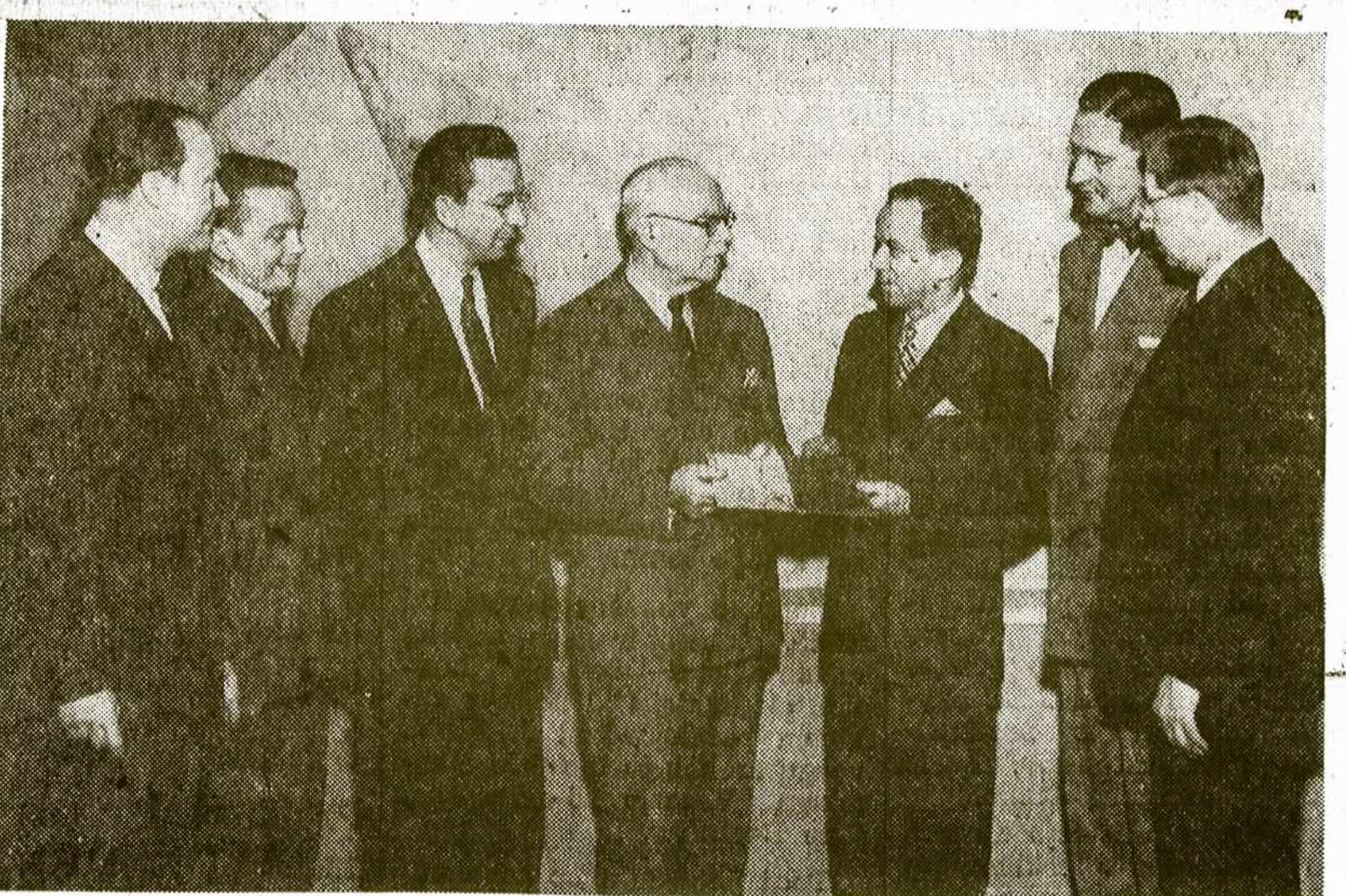
Pirmosios Amerikos Balso (Voice of America) lietuviškosios transliacijos programos 1951 m. Vasario 16 d. įteikimo ceremonijos Lietuvos Ministrui Jungtinėse Amerikos Valstybėse.