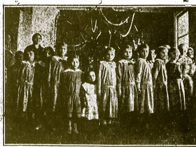
Vaikučiai lietuviškų mokyklų mažesniuose miestuose.