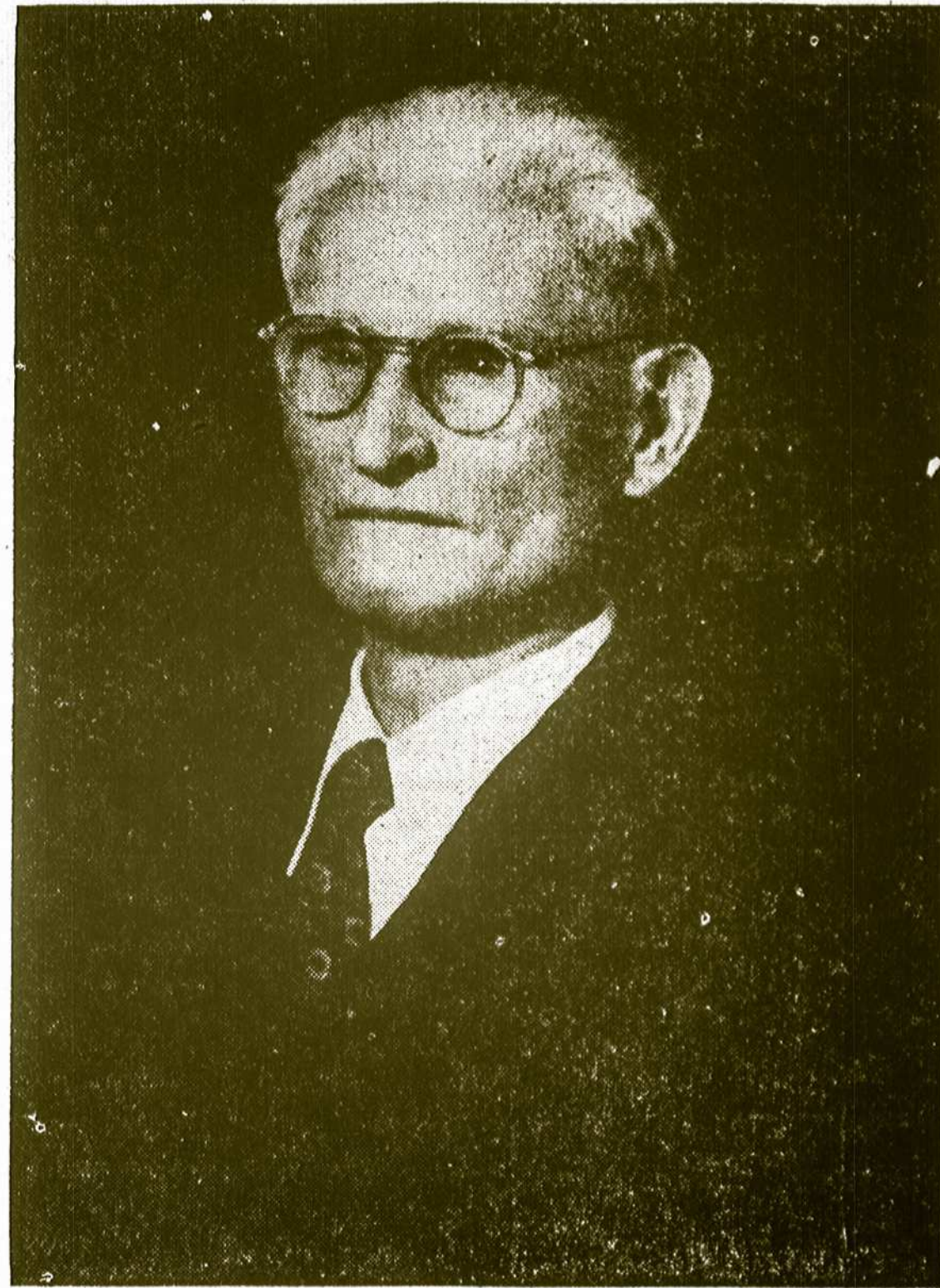
DR. KAZYS GRINIUS

šis mūsų tautos laisvės amžius. Kada su nauju pavasariu ir Priskėlimo šventėmis keliasi visa