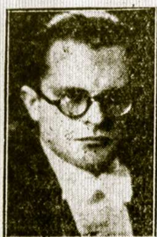
Prof. Vytautas Bacevičius

Prof. Vytauto Bacevičiaus Koncertas šį šeštadienį