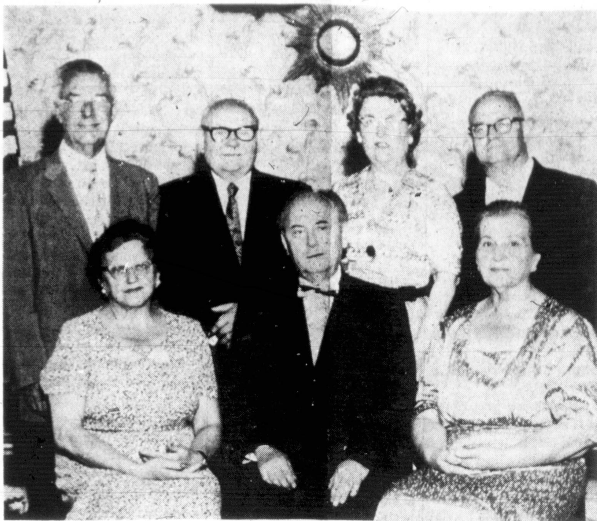
SLA PILDOMOJI TARYBA

Taigi, Berlyno ir Vokietijos klausimo sprendimas priklausys nuo daugelio veiksnių. Tačiau, suradus tuo klausimu abiem pusėm priimtą sprendimą dar nebutų pasiekta pastovesnė taika. Kol sovietai laiko vergijoj daugelį tautų ir neatsisako nuo groboniškių kesių pavergti komunistui laisvajį pasaulį, tol negali būti ir pastovesnės taikos.