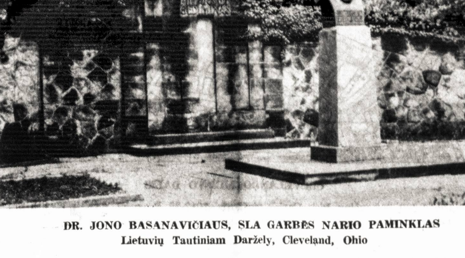
DR. JONO BASANAVIČIAUS, SLA GARBES NARIO PAMINKLAS Lietuvių Tautiniam Daržely, Cleveland, Ohio

PAŽINKIM CLEVELANDAI IR JO LIETUVIUS (Pabaiga) JAU KETVIRTAS SLA SEIMAS CLEVELANDE. Šis 54-tas SLA seimas yra jau ketvirtas įvyksta Clevelande. 1907 m. įvyko pirmutinis. 1936 m. — 50 metų jubiliejinis seimas ir 1962 m. — eilinis seimas.