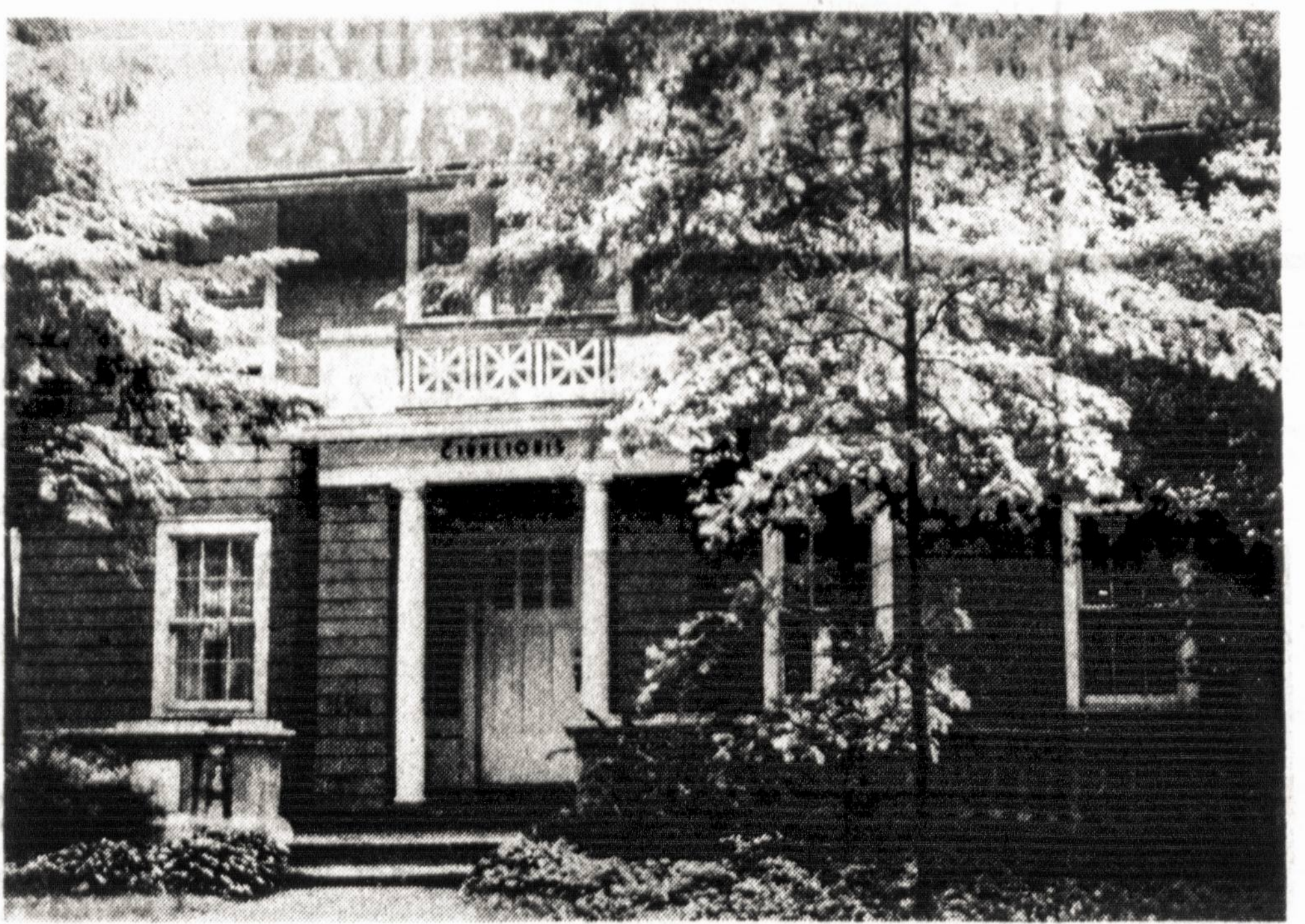
ČIURLIONIO ANSAMBLIO NAMAI CLEVELANDE