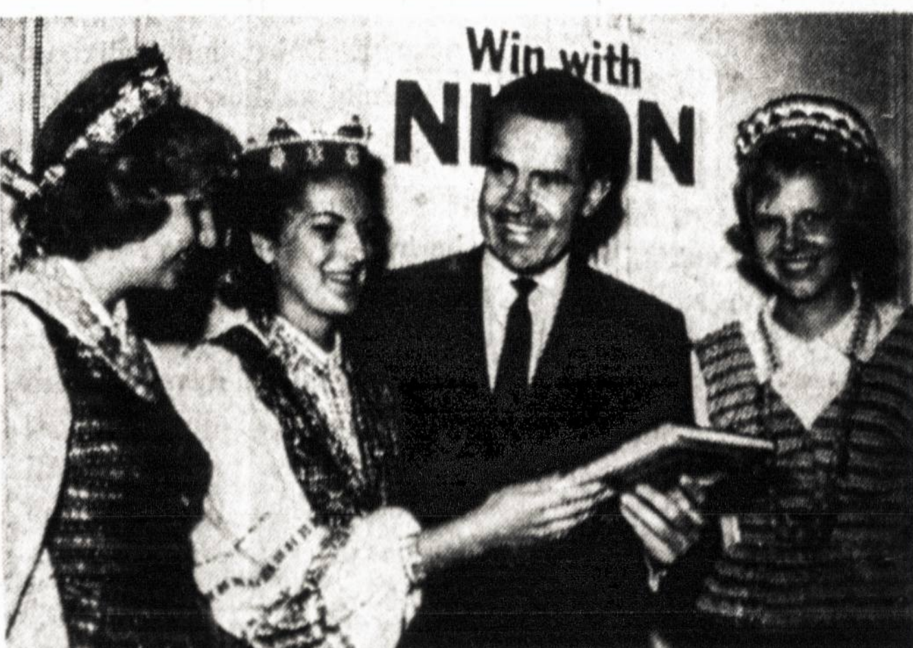
Prezidentas Nixonas su lietuvaitėmis rinkimų metu