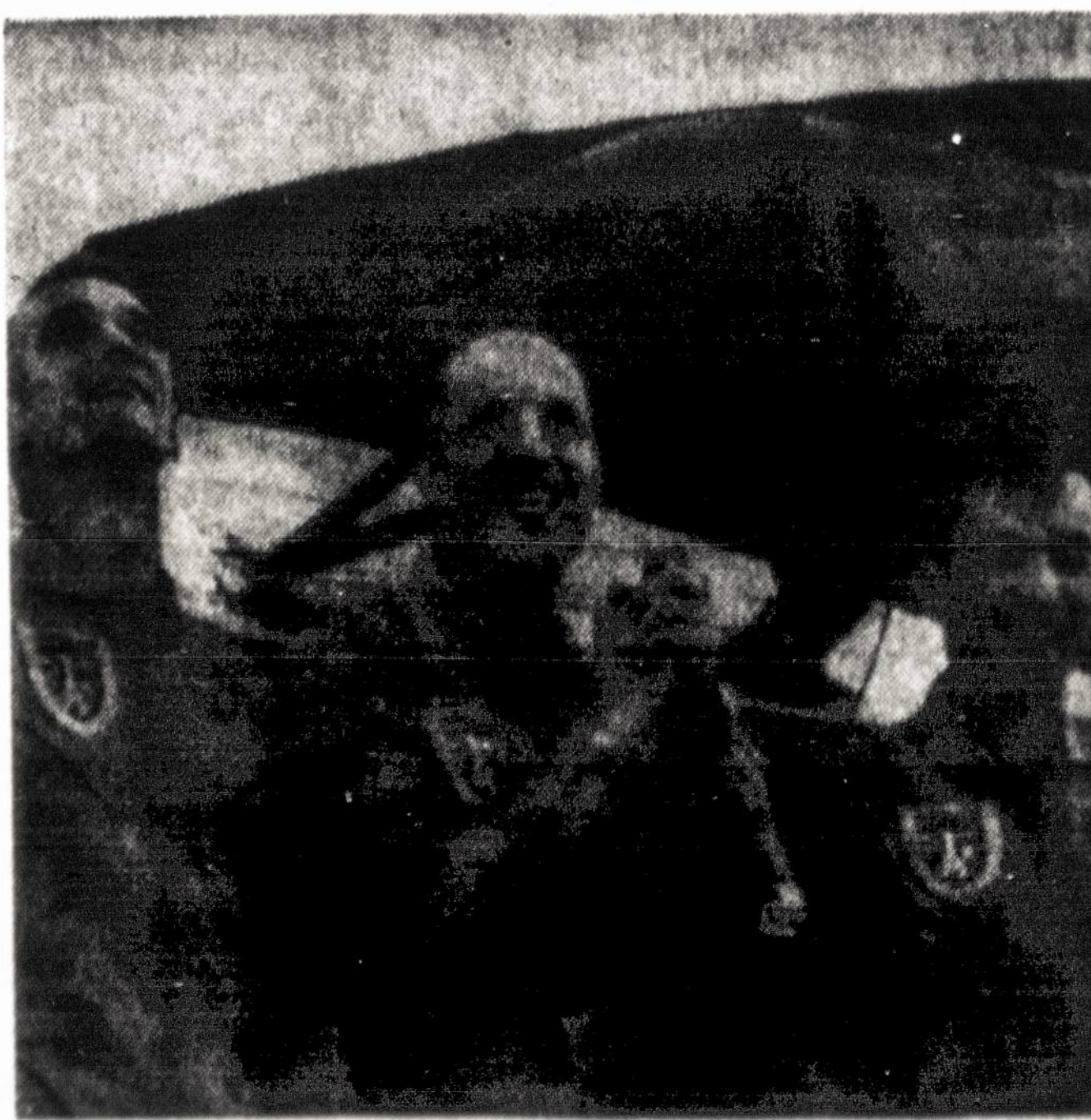
Apollo 10 astronautai. Iš kairės: Eugene Cernan, Thomas Stafford ir John Young.

Gegužės 16 d. Pavergtųjų Seimo delegaciją labai iškilmingai priėmė Prancūzijos Parlamento pirmininko kabineto direktorius (pats pirmininkas buvo išvykęs į užsienius). Gegužės 19 d. delegaciją priėmė Užsienų Reikalų Ministerijos Rytų Europos Departamento direktorius, o gegužės 20 d. — Senato pirmininkas. Kon-