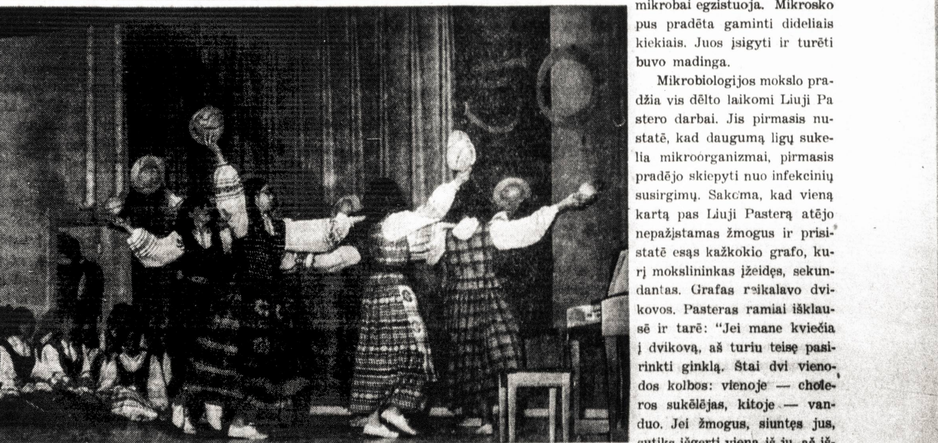
Lituanuose mokykla išmoko vaikams ne tik neuvaisai skaityti, bet ir dailiai šokti tautinius šokius.

Tuos žmones tėvas, narsus karys, pasivairė vien žiemą. Daug tokių tą žiemą pasivairė ir kitų gėimii vyrai.