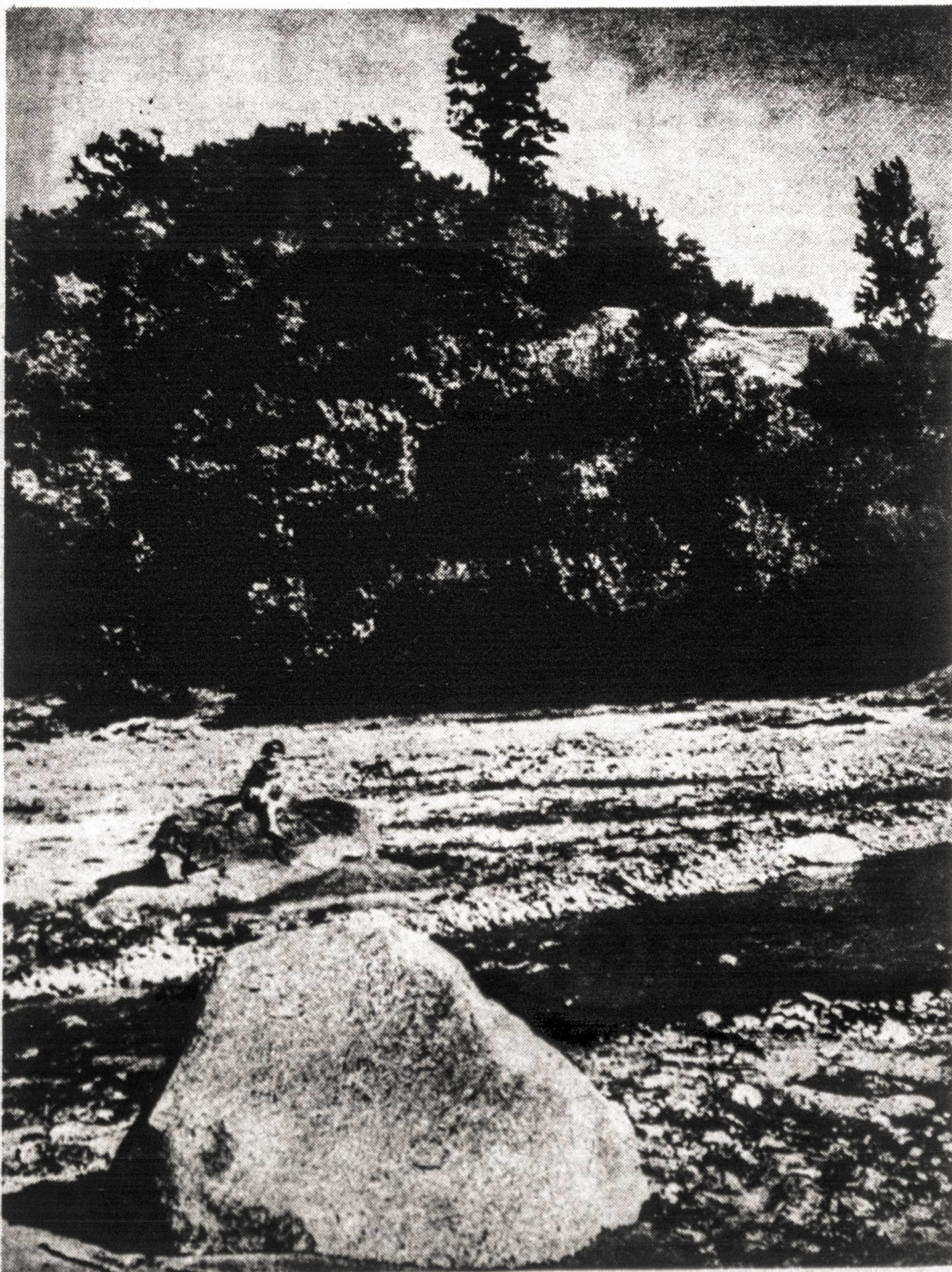
Punios garsus piliakalnis prie Nemuno ir upės Punelės santakos. Čia buvusi legendarinė Pilėnų tvirtovė, apie kurios karžygiškus gynėjus rašė daugelis rašytojų, pradedant Syrokomla ir baigiant M.Šikšniu, kurs parašė dramatinį veikalą "Pilėnų Kunigaikštis". Šią pilį pagarbino poetas Maironis ir Vincas Krėvė.

Vėliau Punią valdė įvairūs didikai. Bažnyčia minima nuo Vytauto laikų. XVI šimtmečio pradžioje Puniai suteiktos miesto teisės, herbas. Valdant Punią įvairiems vietininkams, sunkėjo priespauda, išnaudojimas.