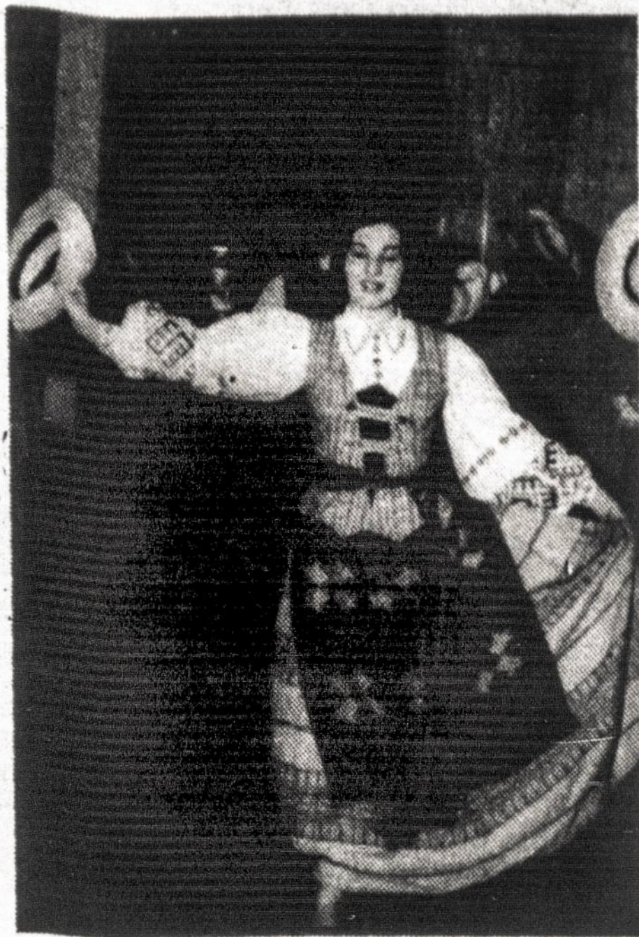
Vasario 16 gimnazijos mokinės šoka tautinį šokį "Kepurinė".