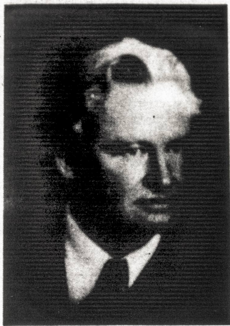
Kipras Petrauskas, kaip jis atrodė Kaune 1934 metais.

Didžiojo dainininko Kipro Petrausko išlikusios plokštelės nėra gausios, o ir esančios dažniausiai techniškai nebuvo labai aukštos kokybės.