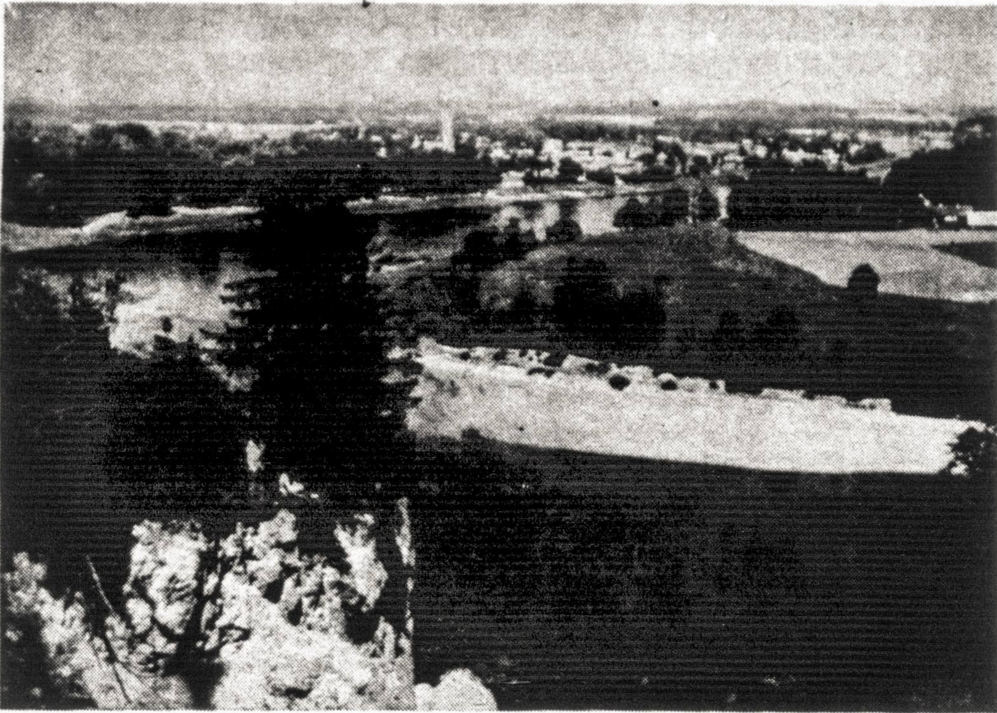
Nemuno kilpa ties Birštono vasarviete su gydomais šaltiniais

Atsimušęs nuo kairiojo statau šlaito, Nemunas įsirėžia į dešinę pašlaitę, ją plau-na, ir todėl visą laiką tai vienoje, tai kitoje pusėje matome stačiasienes atodangas. Jos atveria šių apylinkių ledyninių nuogulų vidinę sąrangą: vandens suplauti žvirgždo klodai, priemolis, vėl kitos kilmės sluoksniai. Daug kur tie žvirgždai rausvai nudažyti prasisunkiančių geležingų vandenių. Šios atodangos nuo seno žinomos Kernuvių vardu. Tai kaimelio, kuris aukštai - lyg gandro lizde įsikūręs, pavadinimas. Pusračiu tos atodangos lydi upę, iki ji baigia posūkį Prienų link. Išsitiesus vagai, pastebimai žemėja ir dešinysis šlaitas. Į jį įlipus (o tai patartina padaryti), nesunku pamatyti, kad paviršius vėl staigiu skardžiu krinta į kitą pusę. Ten irgi Nemunas, tik jis teka jau į pietus. Tai pati siauroji Birštono sąsmauka. Geologiniu požiūriu ši slėnio dalis viena įdomiausių visoje Nemuno tėkmėje.