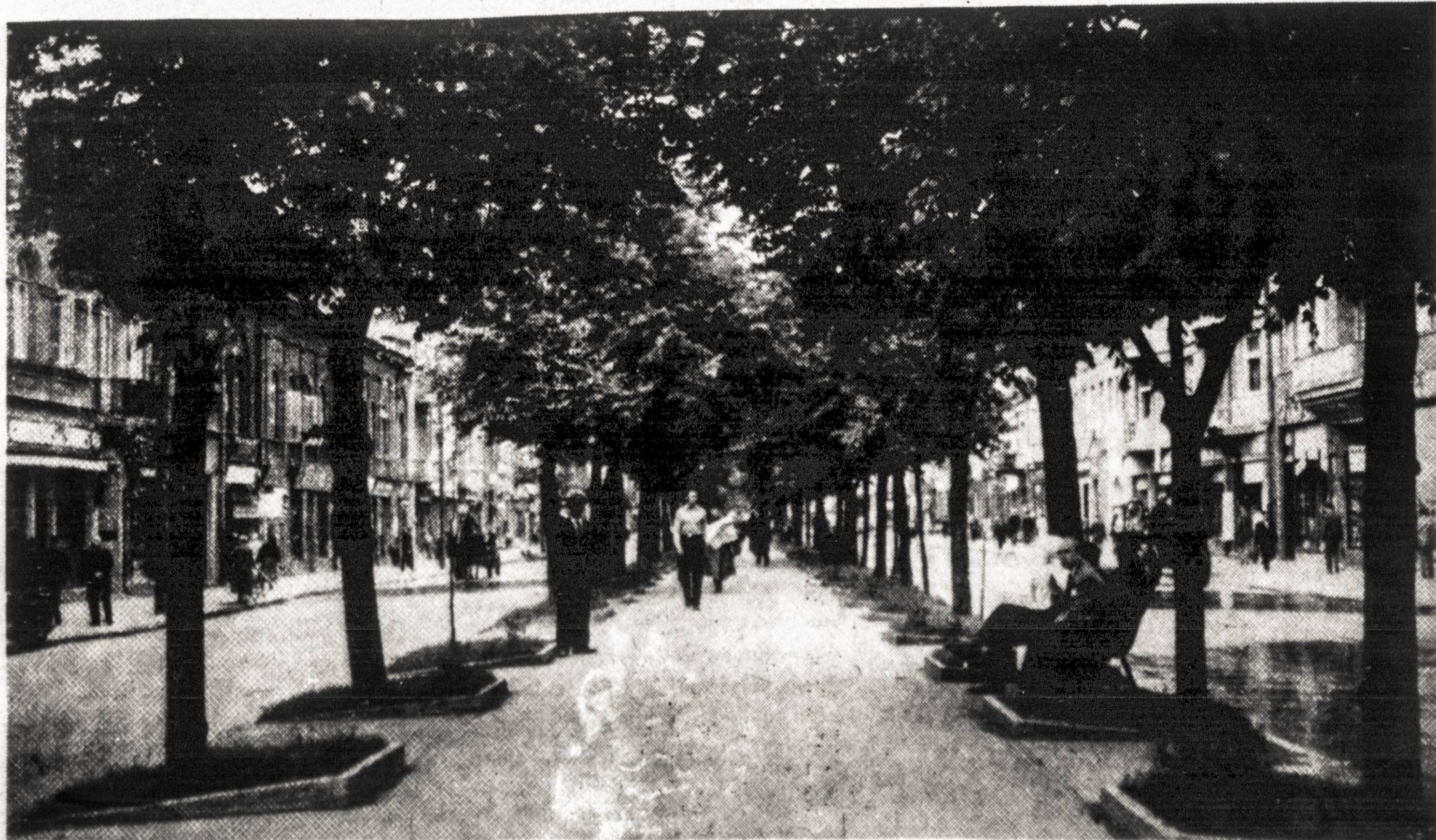
GARSIOJI LAISVĖS ALEJA KAUNE, KAIP JI ATRODYDAVO NEPRIKLAUSOMYBĖS LAIKAIS