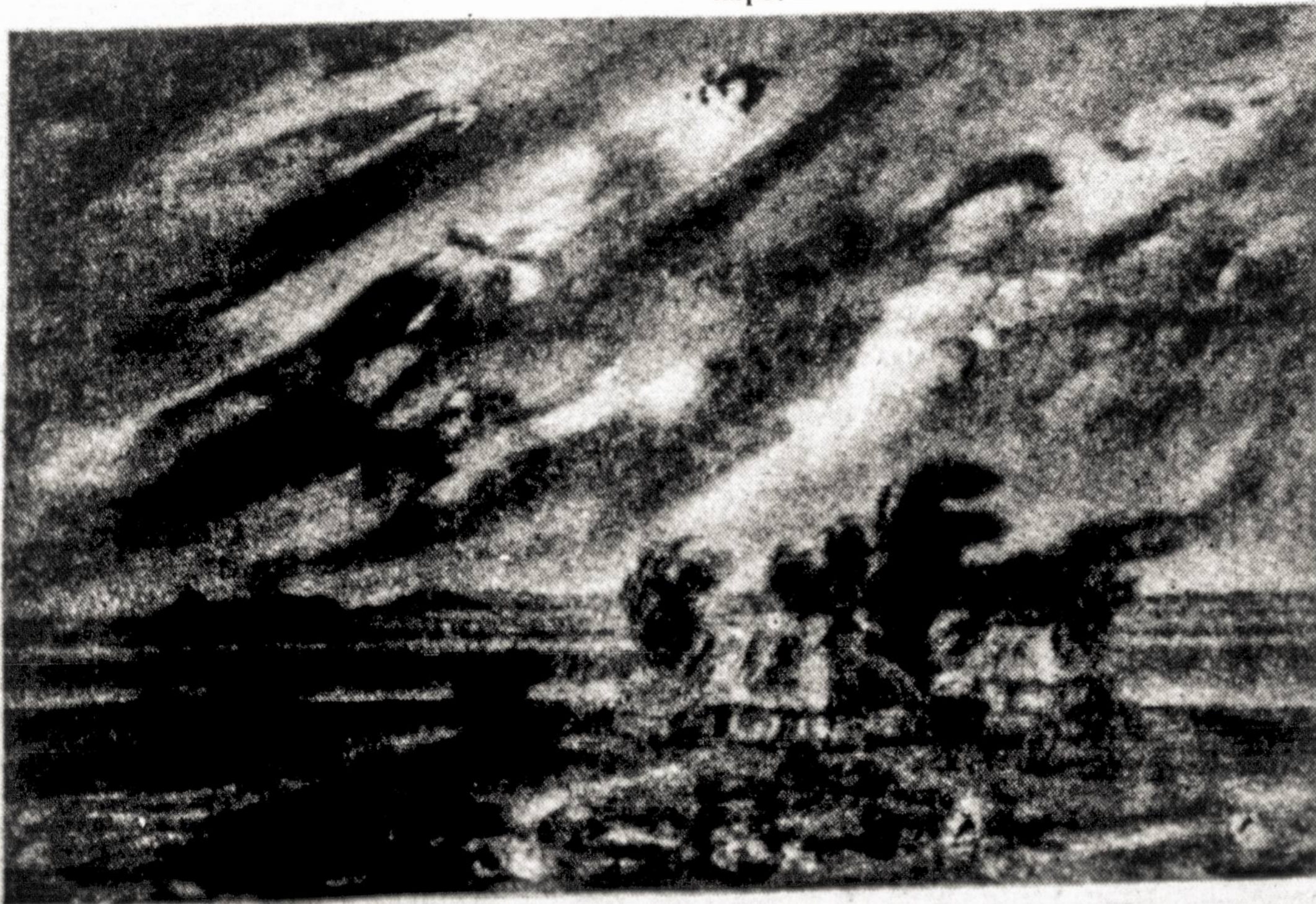
ADOMAS GALDIKAS - ŽEMAIČIŲ ŽEMĖS PAJŪRIS

Gimęs 1894 m., Siparis Lietuvoje buvo laikomas vienu pirmųjų lietuvių aktorių tarpe.