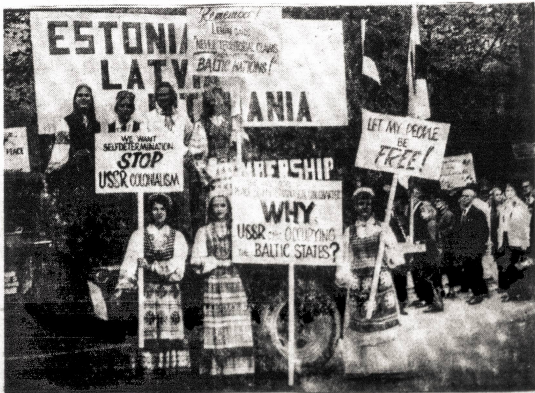
A scene from the October 18 demonstration held by Lithuanians and other Balts.