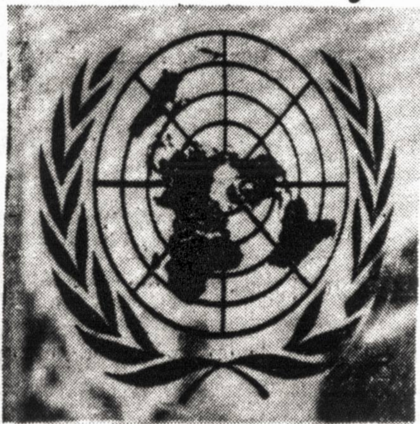
JUNGTINIŲ TAUTŲ EMBLEMA

Tautų Lyga, neatsižvelgiant į daugelio taurių, politinio pasaulio asmenų pastangas skaudžiai pralaimėjo ir neteko autoriteto, kai nepajėgė sutrukdyti Antrojo pasaulinio karo. Bet karui pasibaigus vis tiek buvo antru kart pasiryžta sukurti tarptautinę organizaciją, kuri svarbiausia pagelbėtų išlaikyti taiką pasaulyje. Jungtinių Tautų kurėjai turėjo daug vilčių ir tikėjo, jog šiuo syk jiems pavyko surasti veiksmingas priemones suformuoti santykius tarp visų valstybių. Deja, šiandien gal daugumos Jungtinių Tautų kurėjų jau nėra gyvųjų tarpe ir jie jau nemato, kaip klostosi šiandien reikalai.