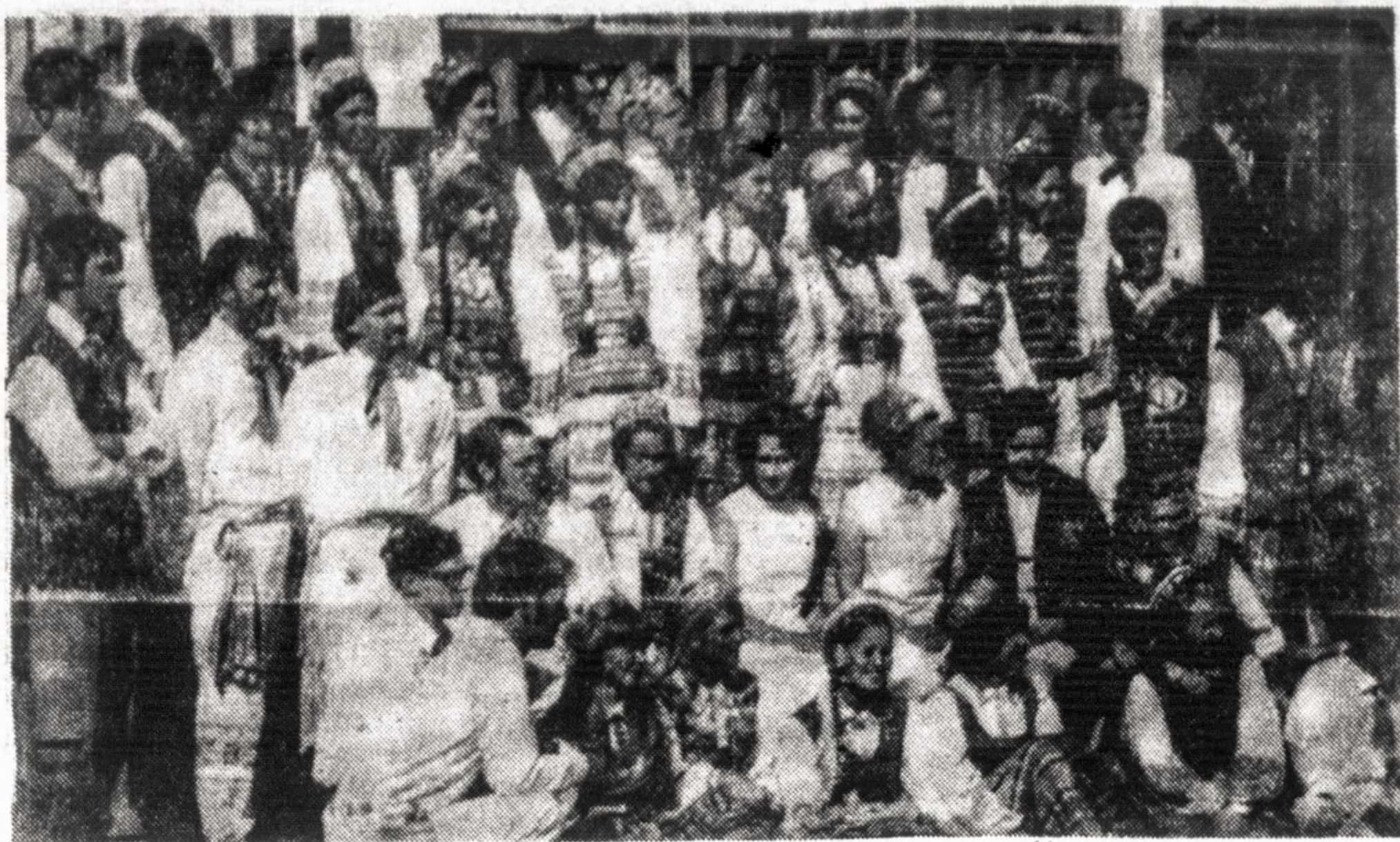
Kanados tautinių, šokių, ansamblių "Gyvataras" ir "Atžalynas" šoko lietuvių dienoje bendrai.