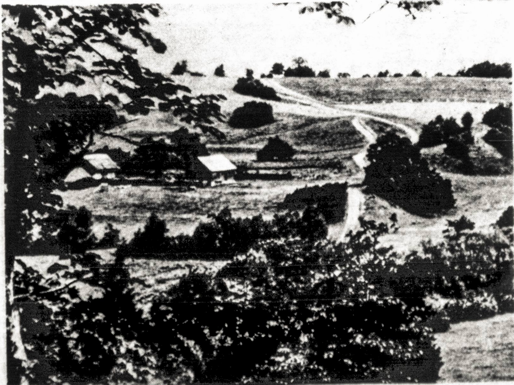
Ledynu laikais iškilusios žemaičių žemės kalvos

Paskui atšilo. Ledynas, smarkiai aptirpęs, gana toli pasitraukė. Vėliau vėl atšalo. Į Vidurio Lietuvą įslinko dvi didžiulės ledyno plaštakos. Viena jų slinko iš vakarų ir pasiekė Veiverių-Raseinių-Viduklės liniją. Kiek vėliau iš šiaurės atslinko kita, truputį nustūmė atgal pirmą ir sustojo Šiaulių-Radviliškio-Seduvos-Krakių-Vilkijos-Jonavos-Ukmergės-Kavarsko ruože. Šis ledynas tirpo lėtai, buvo susiskaldęs į didelius liežuvius. Ledyno pakraštyje buvo susitvenkęs buvo didelis prieledyninis ežeras. Gilesnėse šio ežero vietuose klostėsi moliai, kurie paplito Kauno, Kaišiadorių apylinkėse. (B.D.)