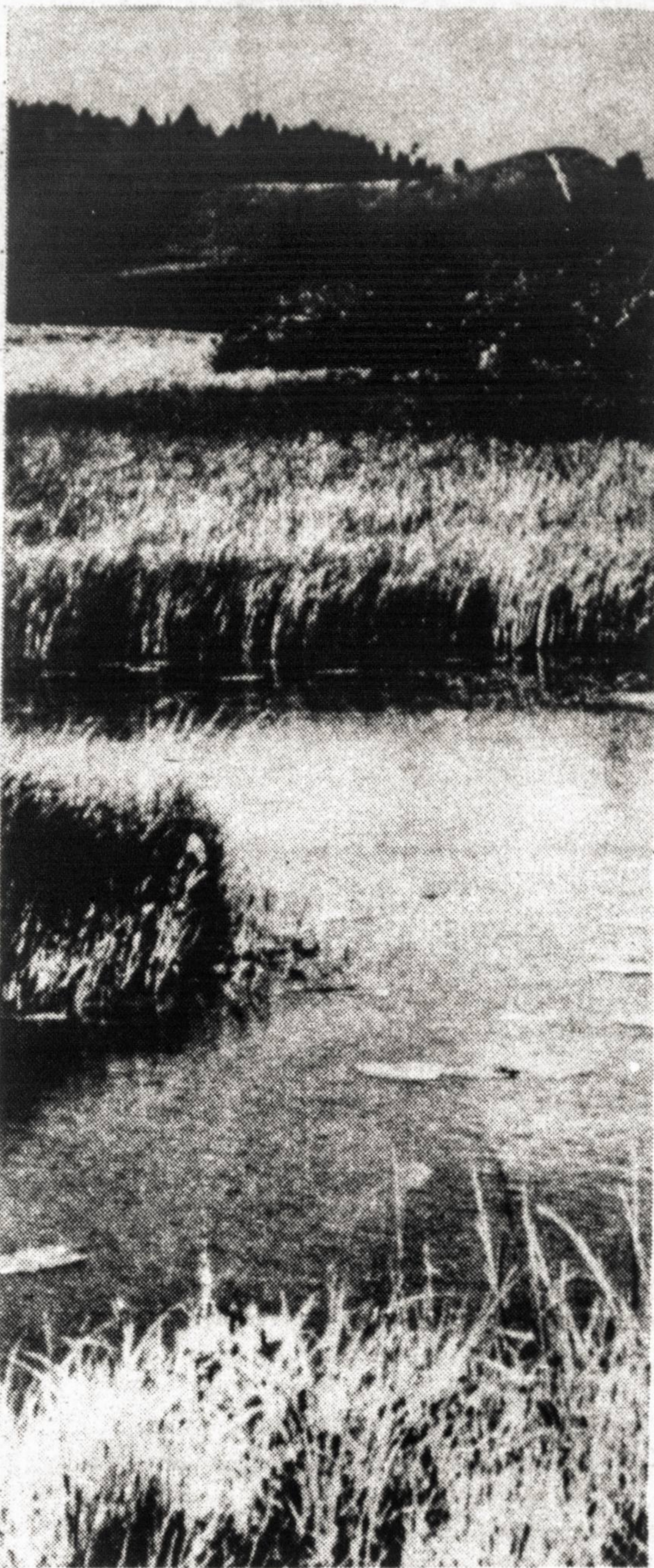
Įspūdingai apželę Dubysos krantai.

Dar toliau, dešinėje slėnio pusėje, atokiau nuo šlaito yra Bazilioniai - garsios praeities