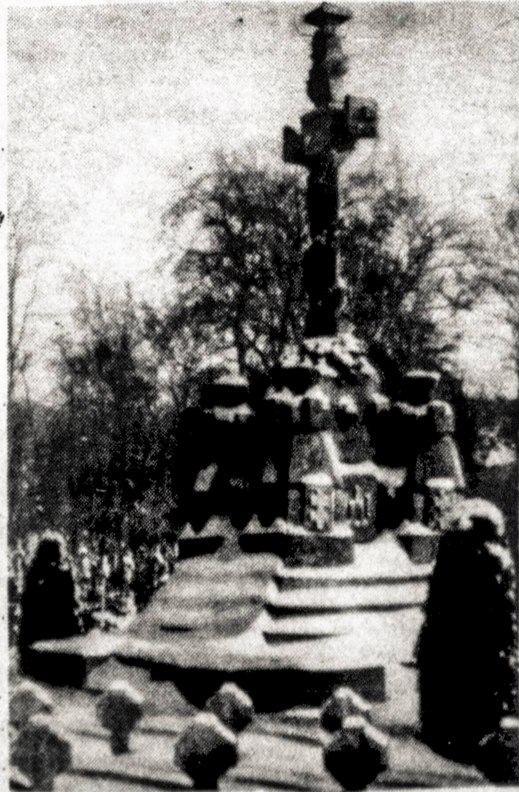
Žuvusiems Lietuvos kariams paminklas Kaune