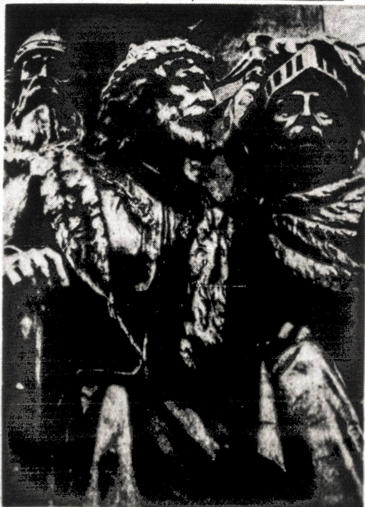
DIDIEJI LIETUVOS KUNIGAİKŠČIAI: GEDIMINAS, ALGIRDAS IR VYTAUTAS. (Senovinis paminklas)

Baigdamas giliai nuoširdžiai sveikinu mielus tautiečius Tėvynėje su Naujaisiais 1971 Metais. Linkiu, kad jie būtų jums lengvesni ir sėkmingesni. Visi lietuviai už Tėvynės ribų ryžtingai dirba dėl Lietuvos ir jos tautiečių šviesesnės ateities.