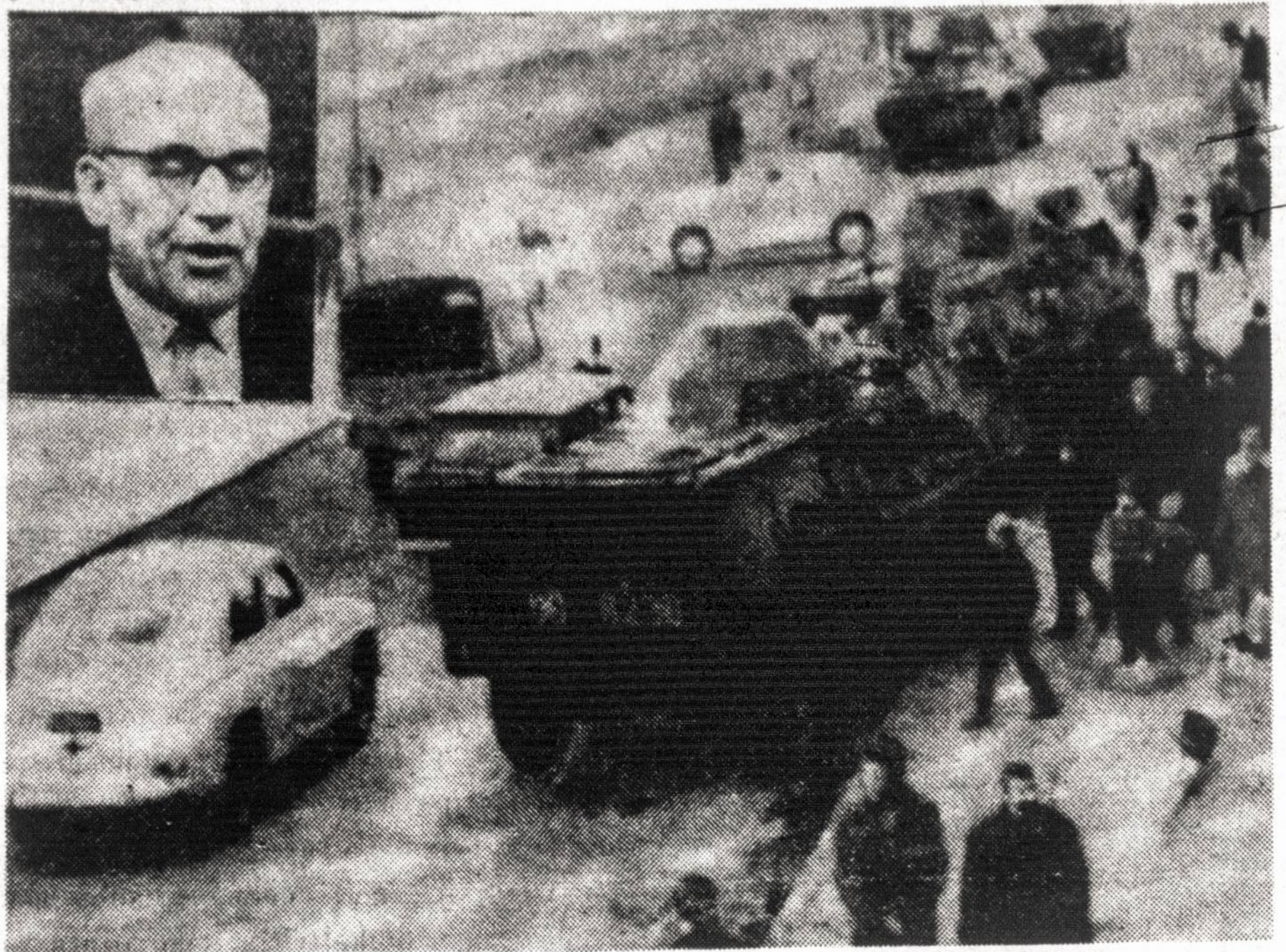
Lenkų komunistų kariuomenė puola Lenkijos darbininkus, sukilusius prieš nepakenčiamą režimą. Vaizde šarvuoti automobiliai malšina Štetino gatvėje demonstruojančius darbininkus. Kampe buvęs Lenkijos diktatorius Gomulka, kuris po šių riausių buvo iš savo pareigų pavarytas.

Naujas Lenkijos komunistų partijos generalinis sekretorius Edward Gierk laikomas žymiu ekonomistu ir dedamos viltys, kad jam pavyks sutvarkyti ūkinius reikalus. Apie įvykusios pasikeitimus atsirado daug spėliojimų. Tačiau apie bendro politinio kurso pakeitimus greičiausia netenka kalbėti, nes viskas įvyko Maskvai diriguojant. O iš ten didesnių pasikeitimų politinėje srityje netenka laukti.