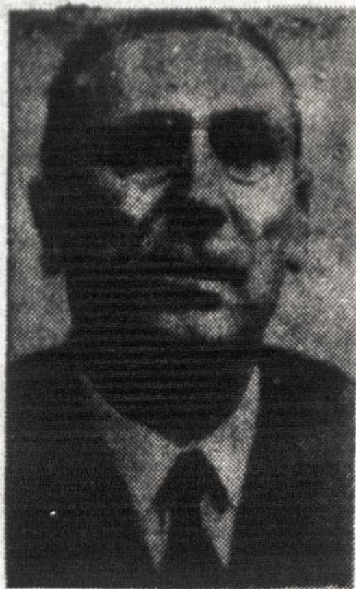
Lenkijos komunistų partijos sekretorius Edward Gierk, naujasis Lenkijos vadas.

Beatodairiniu žiaurumu Lenkijos valdžia numalšino darbininkų sukilimą, kurs ypatingai stiprus buvo pajūrio miestuose, kaip Gdanske, Gdynėje, Štetine ir kitur. Policijai ir kariuomenei, kuri buvo pašaukta malšinti darbininkus, buvo įsakyta šaudyti į demonstrantus. Tad buvo nemaža užmuštų, o dar daugiau sužeistų. Sukilusių miestų gatvėse veikė tankai ir šarvuočiai. Šis sukilimas paliko