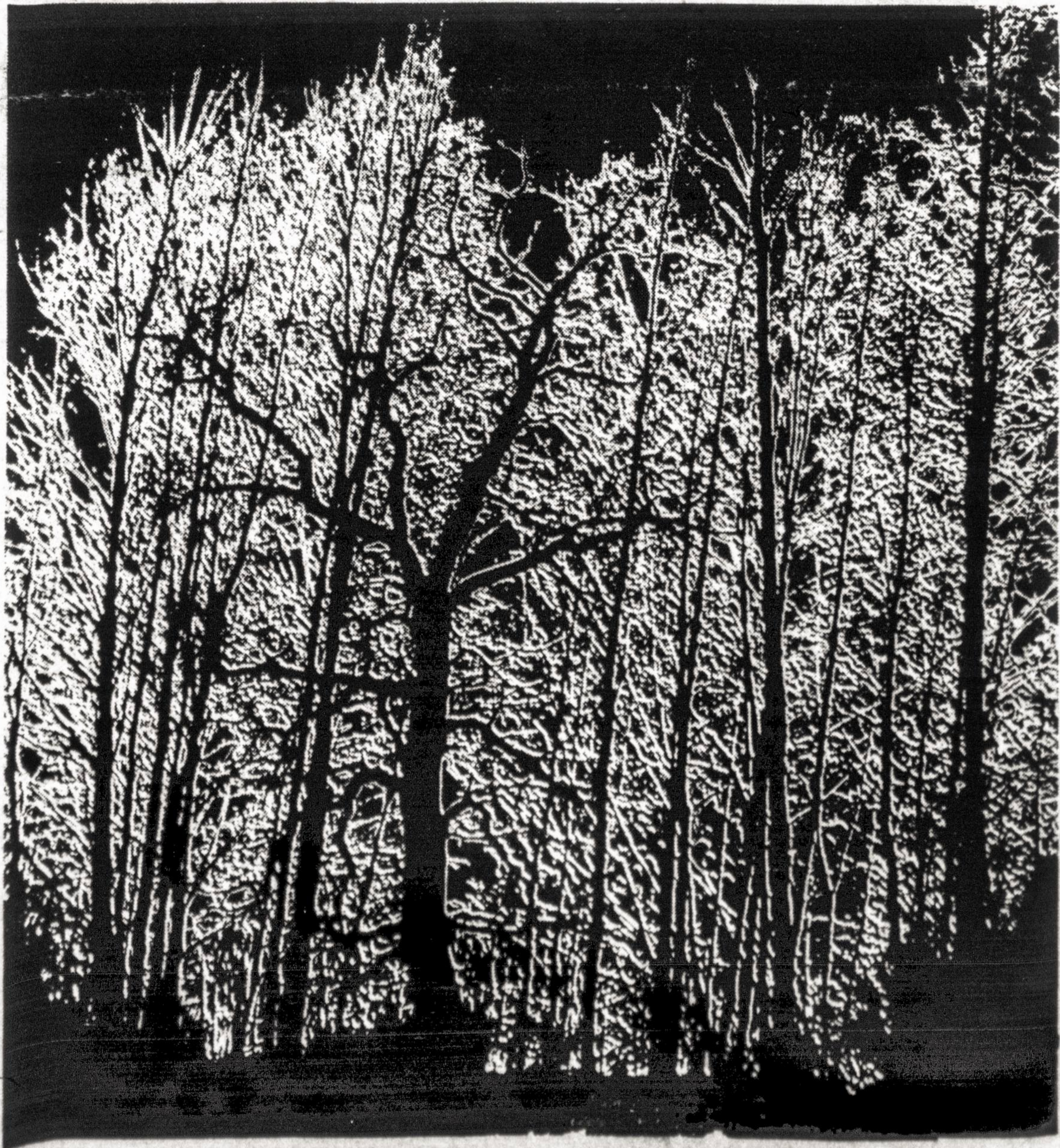
SERKSNAS LIETUVOS MIŠKE

* JUNGTINIŲ VALSTIJŲ ir Kanados valdžios paskelbė bendrą pranešimą, kuriame sakoma, jog ežerų Erie, Ontario, o taip pat St. Lawrence upės pakrančių vandenys pavojingai užteršti. Jeigu pašalinti šį pavojingą užteršimą, reikėtų išleisti apie pusantro bilijono dolerių.