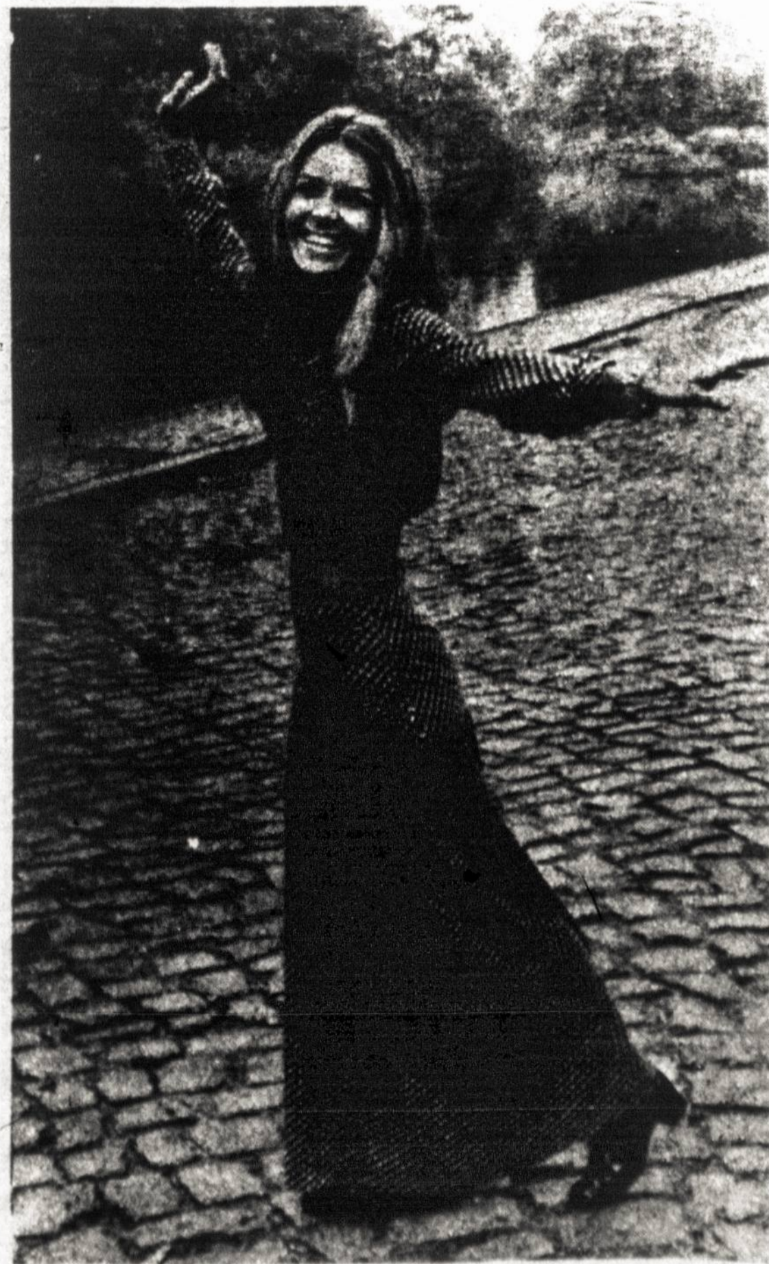
Lena Valaitis, estradinių dainų dainininkė, plačiai pagarsėjus Vak. Vokietijoje. Ji taip pat turėjo pasisekimo Italijoje, Prancūzijoje ir Olandijoje.

Ji pasirodė ZDF programoj "Hit Parade". Tai jau antrą kartą Anelė-Lena Valaitytė pasirodė rampų šviesose.