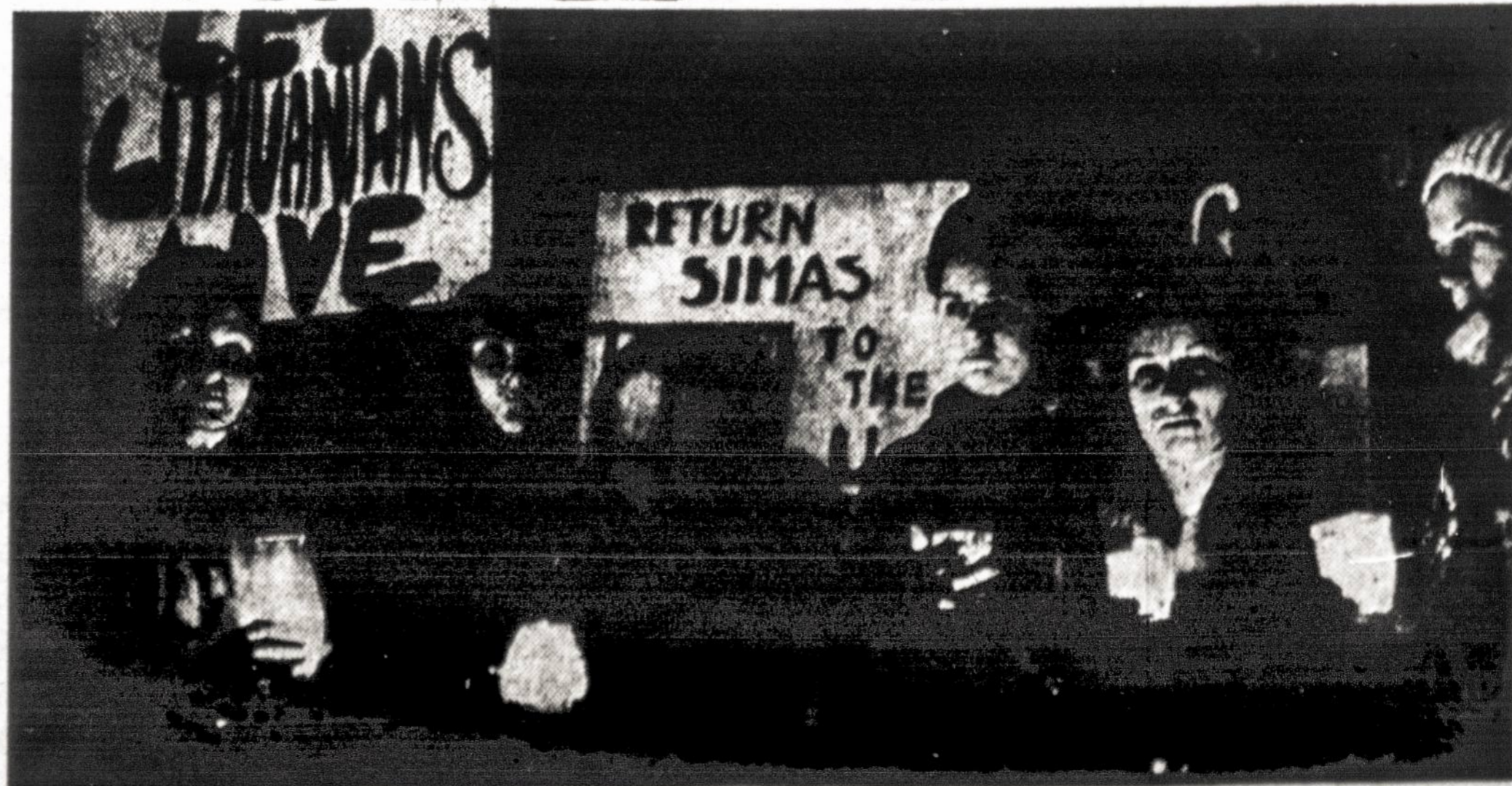
Lietuvių motinų suorganizuota demonstracija New Yorke prieš Jungtinių Tautų sovietų delegacijos pastatą.

Žydai, daugumoje iš Rygos ir Vilniaus atvyko į Maskvą ir įvykdė ten neįprastą demonstraciją. Jie užėmė Aukščiausiojo Sovieto ir Kompartijos kai kurias patalpas ir užsienio žurnalistams pareiškė, kad jie iki tol neapleis savo vietų, kol jiems nebus pažadėtos vizos išvykti į Izraelį.