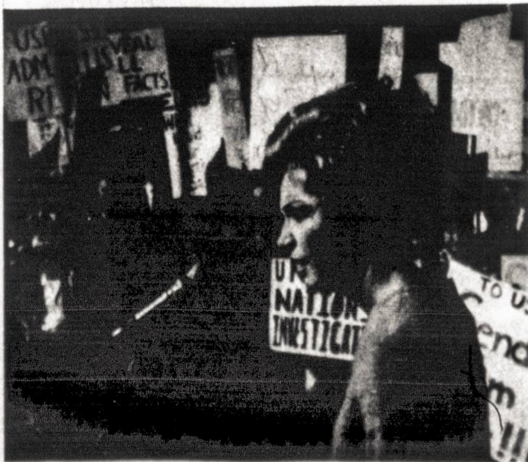
Ruta Lee, the movie star, participates in a demonstration in Los Angeles with other Lithuanians on behalf of Simas Kudirka. She is seen here addressing the participants.

What's the best gift you could give yourself? In terms of long range use, personal gain, and use to others too, good health would make a perfect gift. Our personal health, of course, is not something we can always control. But there are measures we can take to