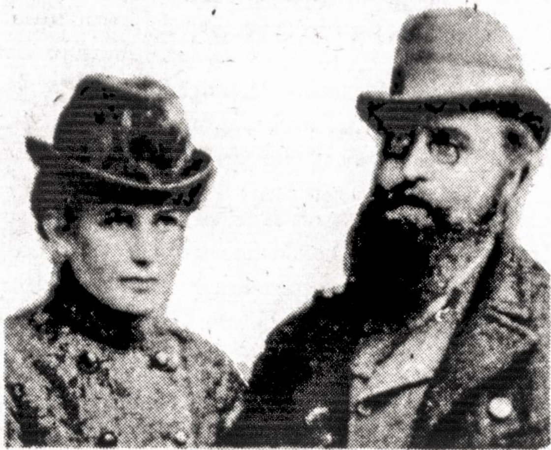
Jonas Basanavičius su žmona

Vaizduotėja matau jį bestovintį ant Dunojaus kranto arba prie juodosios jūros ir stebintį pirmąsias pavasario kregždes, skrendančias Lietuvos pusėn. Kregždės pamešdavo jo pasveikinimą gimtinei, o atsakymo jis laukdavo iš paskutinių rudens gervių.