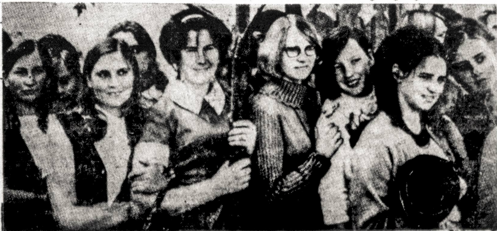
Vilniaus Universiteto studentės dabar taip atrodo.