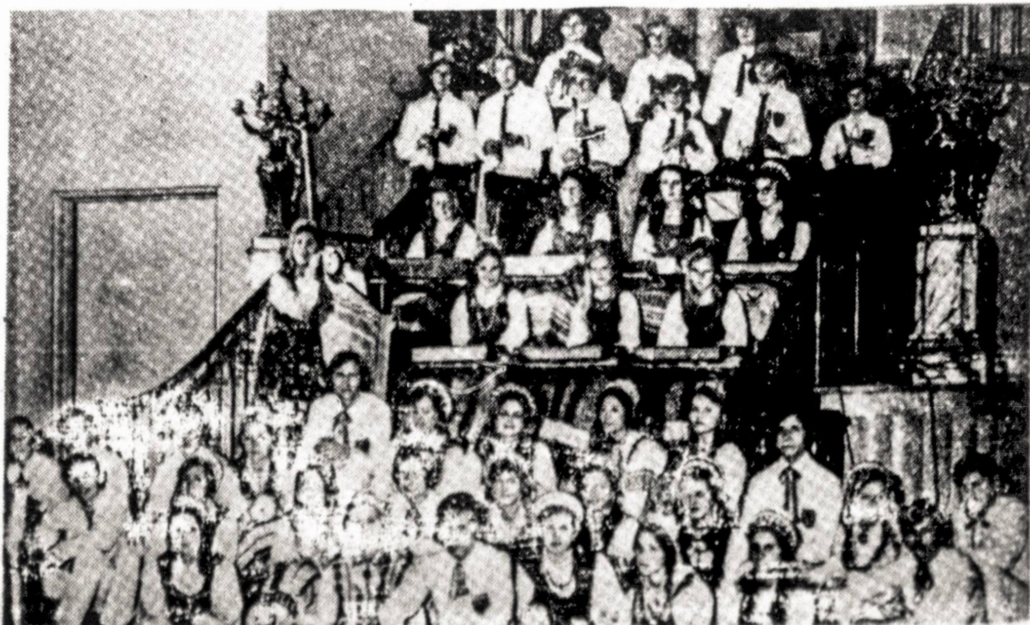
"Gintaro" ansamblio šokėjai iš Montrealio, kurie atliks programą Bostone