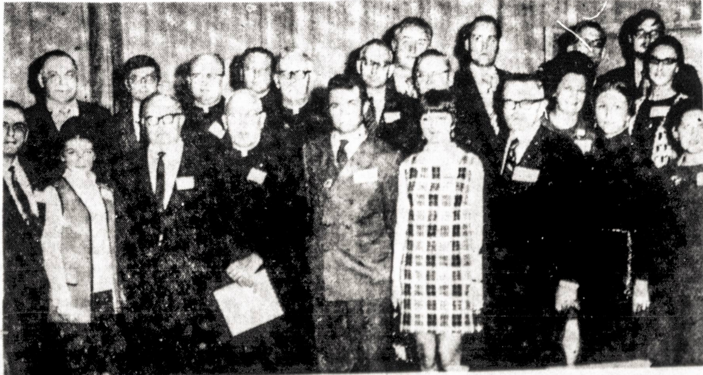
The first Baltic Information media workers seminar took place in New York on March 27th. The photograph shows the Lithuanian representatives who took part in the seminar.

Nuo pradžios šių metų bendrai viso . . . . . $ 39,750.00