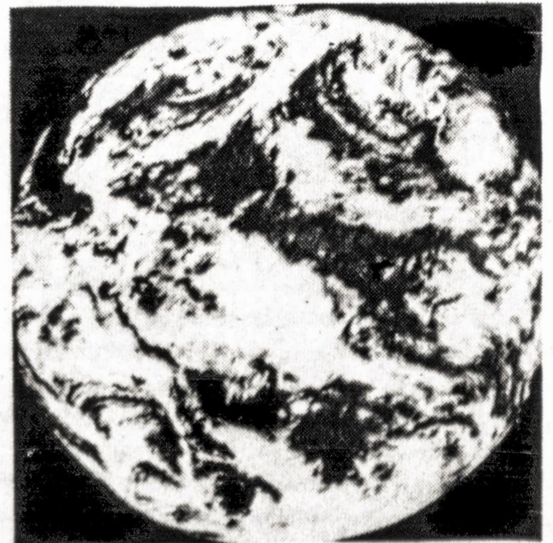
Mūsų žemė, kokią pamatė astronautai skrisdami į mėnulį, ir pirmas jų žodis buvo: - Kokia ji graži!