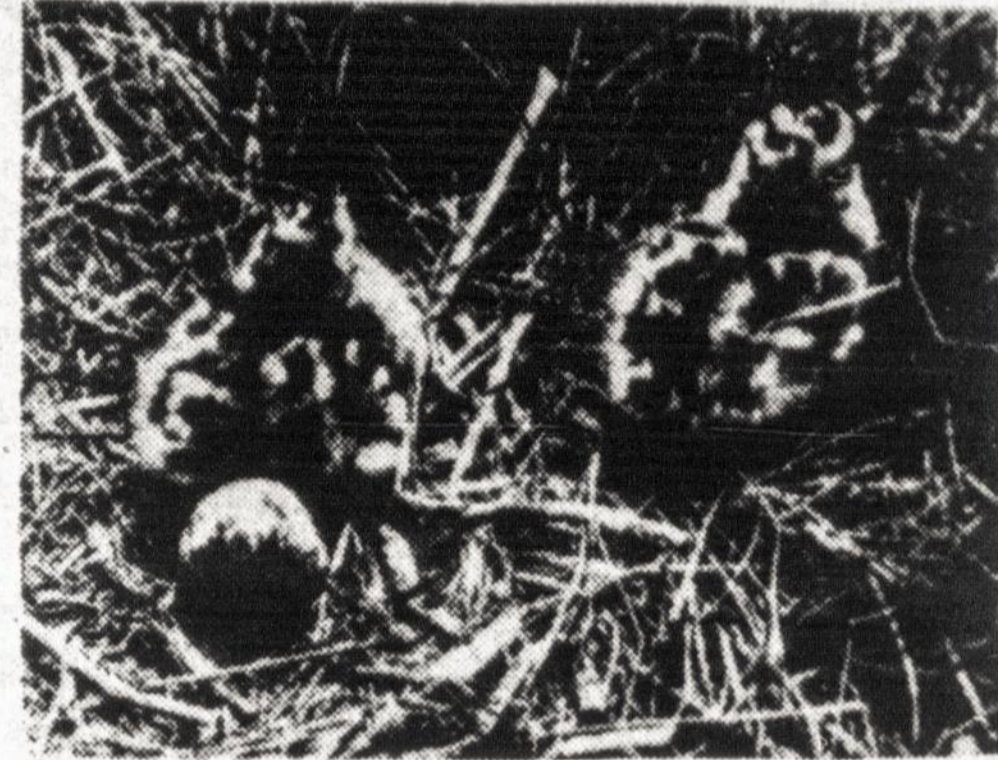
Kirai išperi margus paukštukus, bet kai jie išaugs, tai bus baltasparniai.

ir nendrių lingės. Ore virš salos didelius ratus suka pilkieji garniai. Iš Veisiejų miškų, kur yra jų kolonijos, suskrido į Žuvintą pažvejoti.