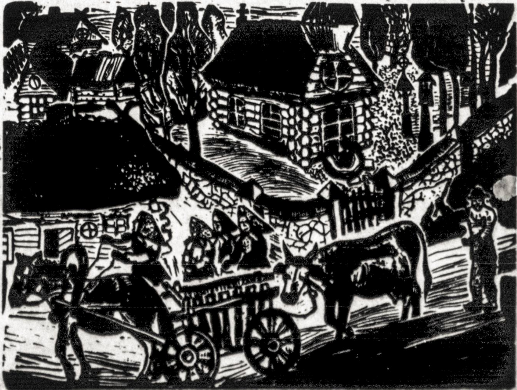
Paulius Augius savo grafiniame paveiksle vaizduoja žemaitį išvažiuojantį į turgų.