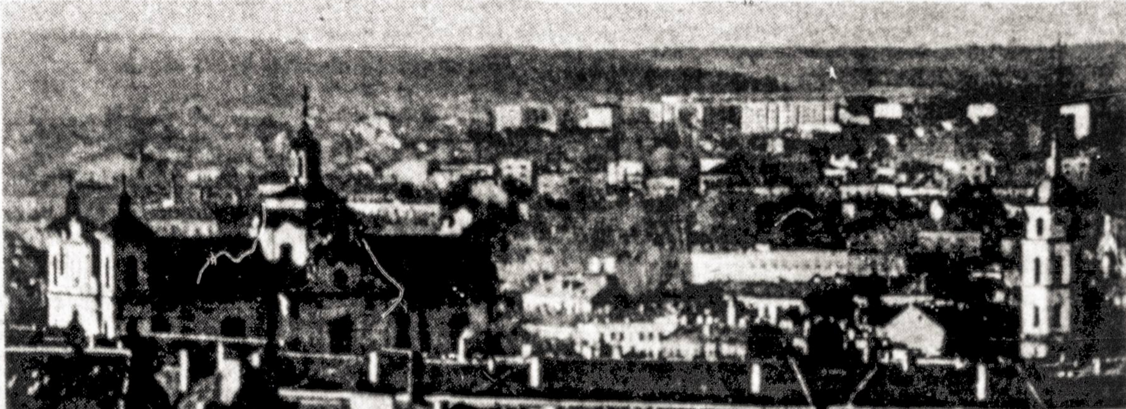
Senieji Vilniaus bokštai. Jie iškilo įvairiais laikais, bet sudaro rarnu Vilniaus stilių, kuris išliks ir tolimesnėje ateityje.

* KOMUNISTINĖ KINIJA, Pentagono žiniomis, jau pradėjo statybą pirmojo povandeninio laivo, varomo atomine energija.