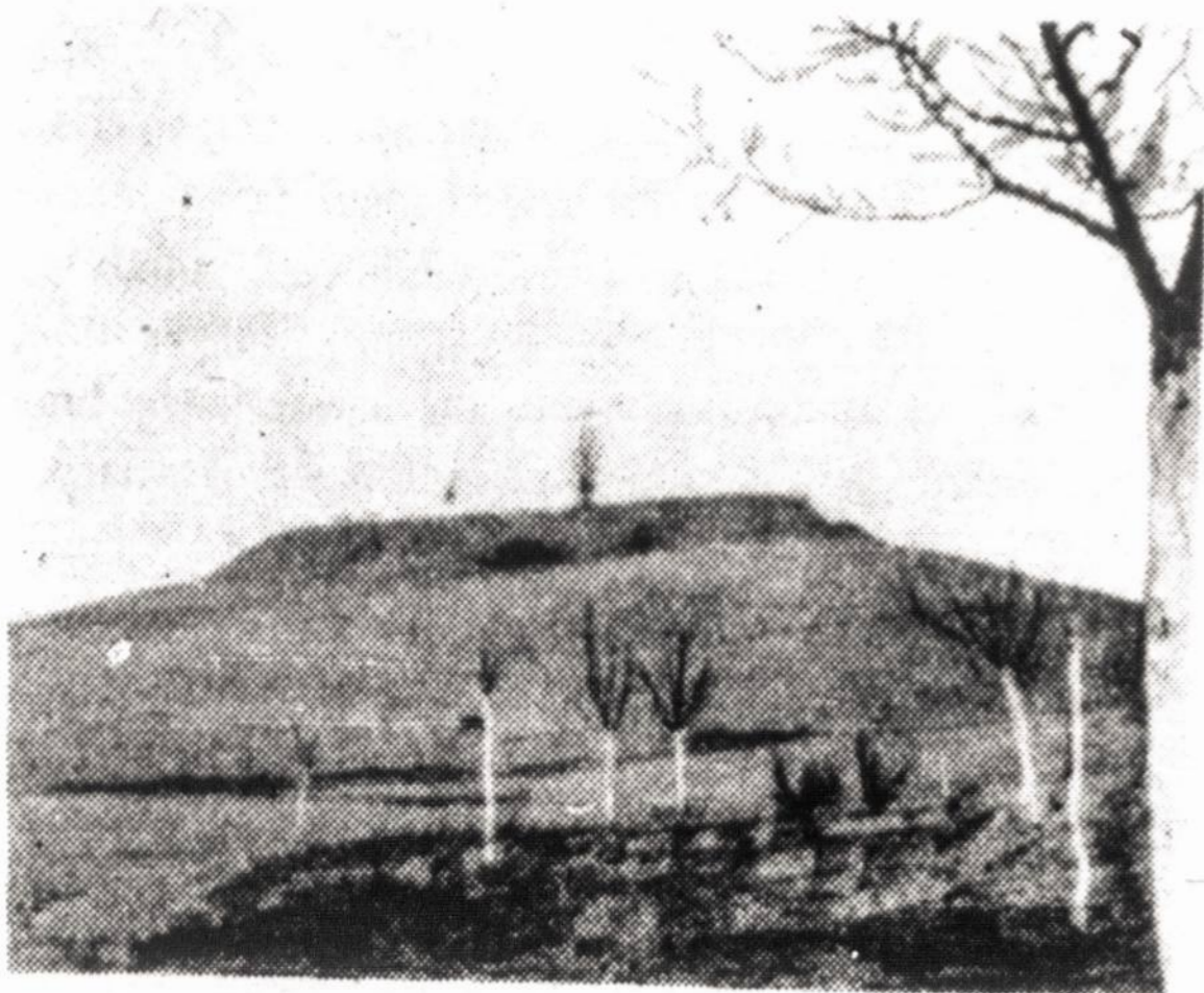
Rudaminos piliakalnis, kaip jis atrodo šiandieną.

Lazdijų apylinkėje Rudaminos piliakalnis - vienas didingiausių Lietuvoje. Jis įrengtas didelės, aukštos, stačiais šlaitais kalvos viršūnėje. Kalvą papėdėje iš dalies supa balos. Jos seniau galėjo būti sunkiai prieinamos raistais, kurie kliudė greitai ir netikėtai pasiekti pilį.