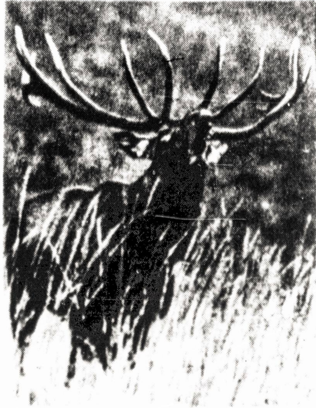
Lietuvos miškų gražuolis - briedis.