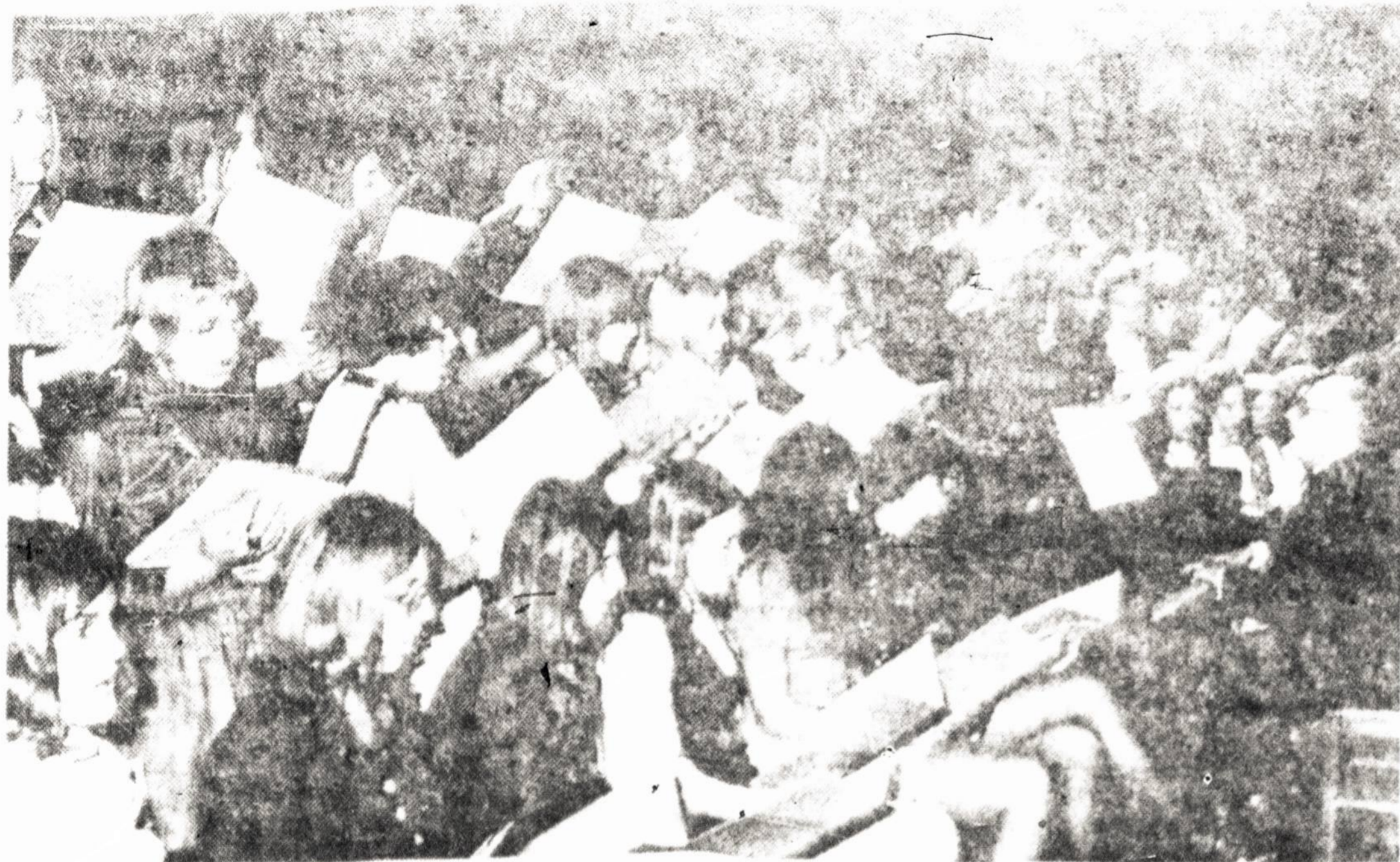
Chicagoje dainininkai pasiruošimo metu. Lietuvių Dainų Šventė.

Visai užsimerkti, nusigrįžti - vieni, rodo, mūsų sąžinė neleidžia. Bet kas mums šių nelaimingųjų gelbėjimo darbo kam tas gali rūpėti?