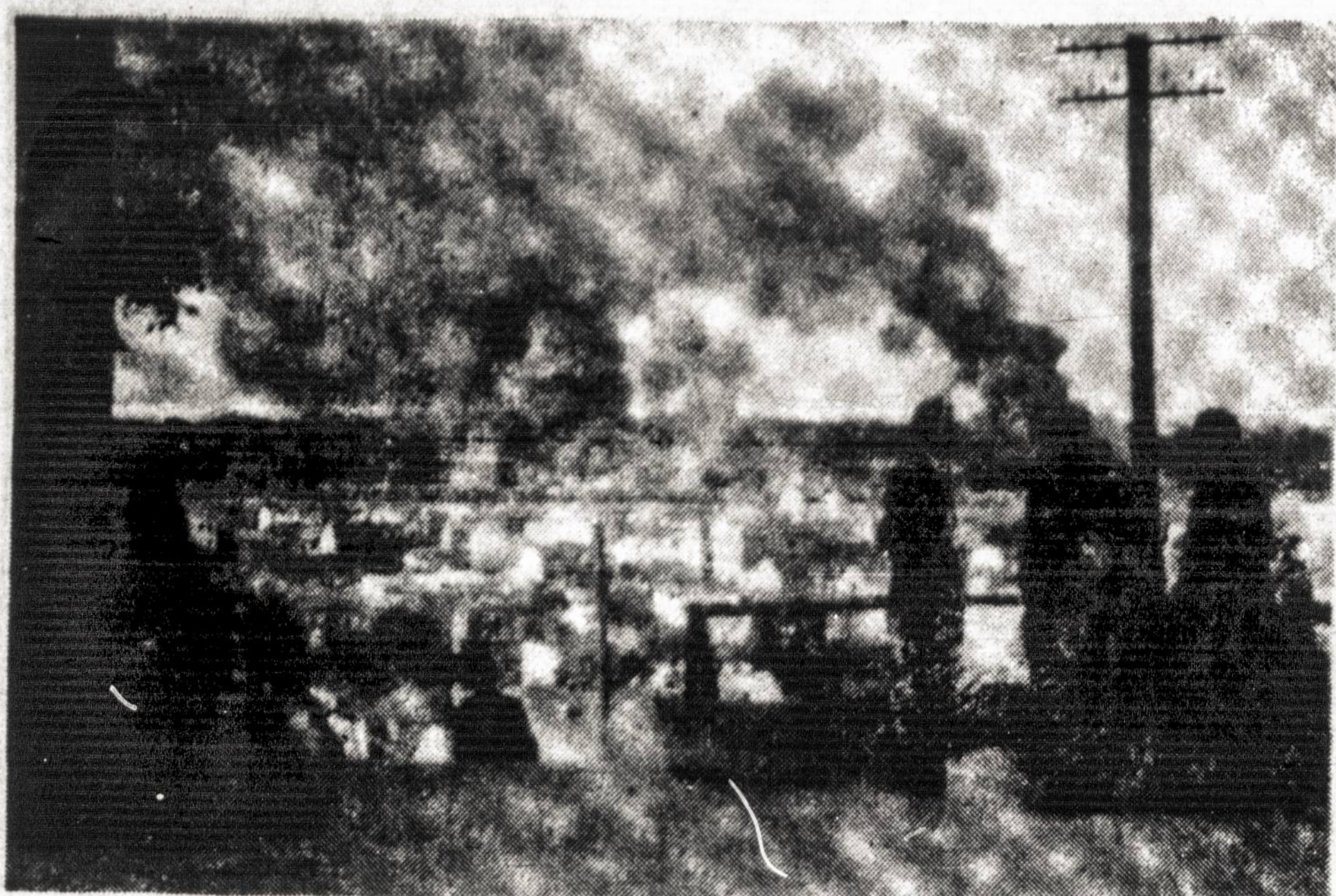
Kaunas 1941 metais, kai vokiečiai pradėjo puolimą prieš rusus, apimtas liepsnų.