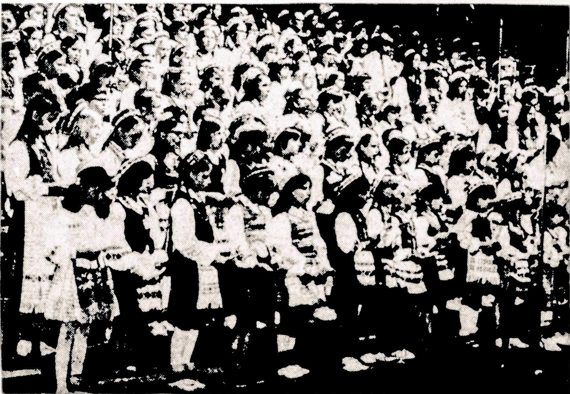
Lietuvių Dainų Šventėje ypatingo įspūdžio padarė jaunųjų dainininkų, daugiausia lituanistinių mokyklų auklėtinių atliekamos dainos. Vaizde matome šio jungtinio choro dalyvius.