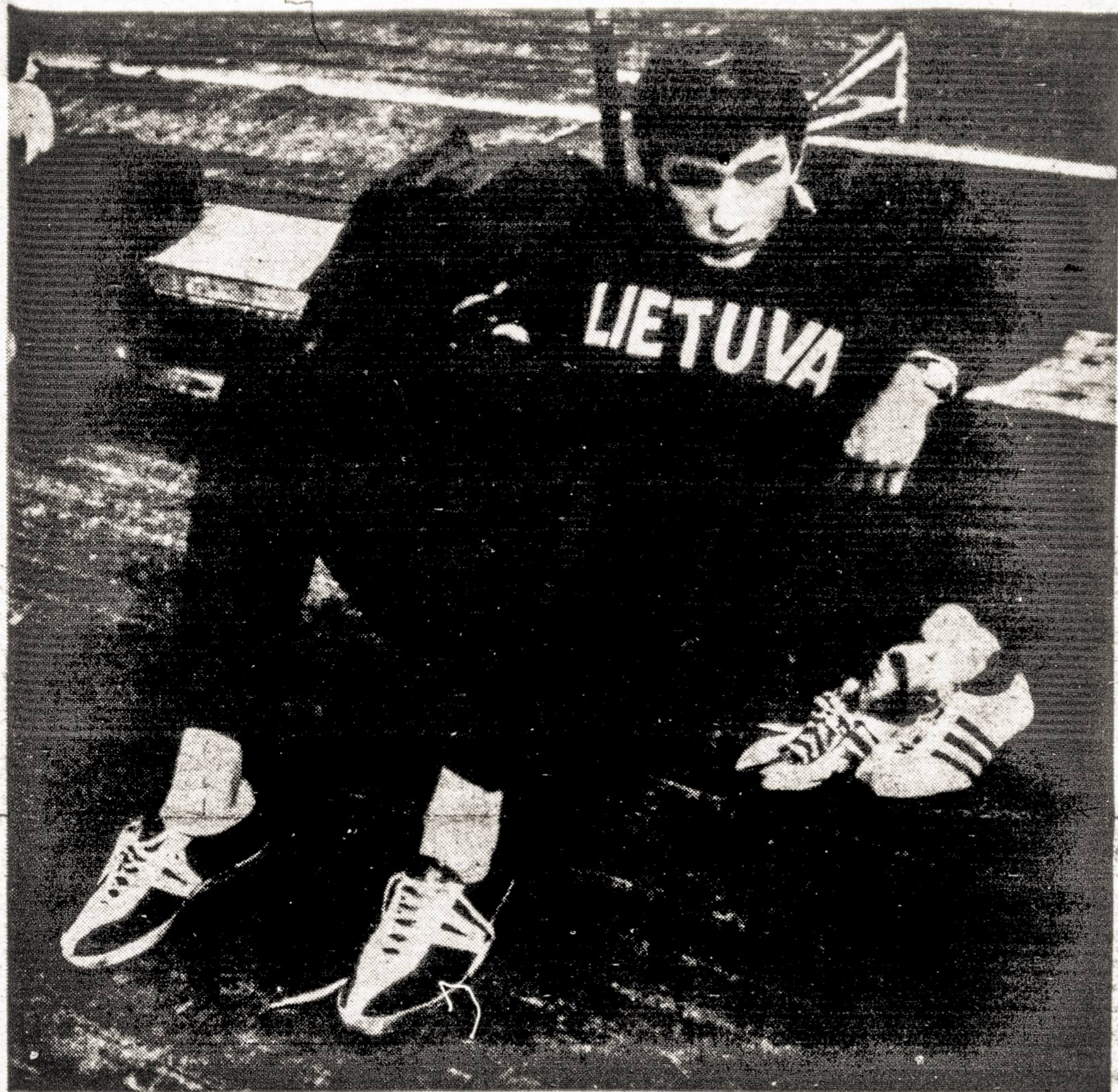
JIS PASIRENGĖS GINTI LIETUVOS GARBĘ SPORTO AIKŠTĖJE.