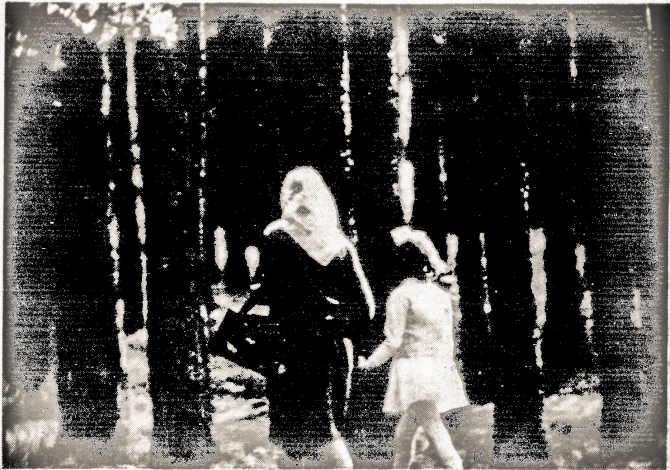
TANKIAME LIETUVOS MIŠKE

Kalbamo pobūdžio erzeli keliantieji asmenys išbando visus galimus savo piktame darbe. Jie dažnai patylomis šnabžda, o susitikę mūsų narius bando paieškoti priekabių. Labai išmintingai padarys mūsų nariai, jeigu atvirai ir tvirtai pasipriešins šmeižtams ir nutildys tuos kenkėjus.