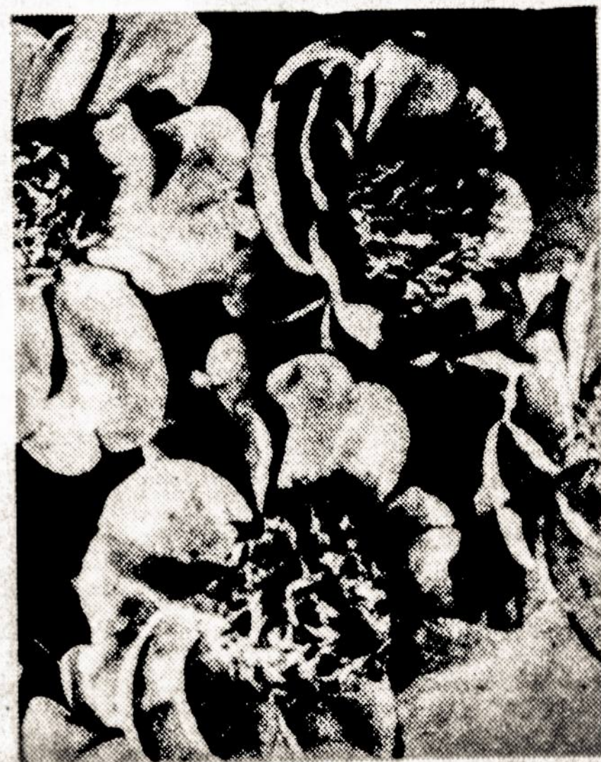
Šitai puikiai žydi bijūnai. Lietuvoje visada jie būdavo gėlių darželio puošmena.

* NEW YORKO vyrų choras sėkmingai baigęs 1970-1971 sezoną, rado reikalingą viešai paskelbti savo padėką lietuviškai visuomenei, spaudai ir radio programoms už pastovią paramą.