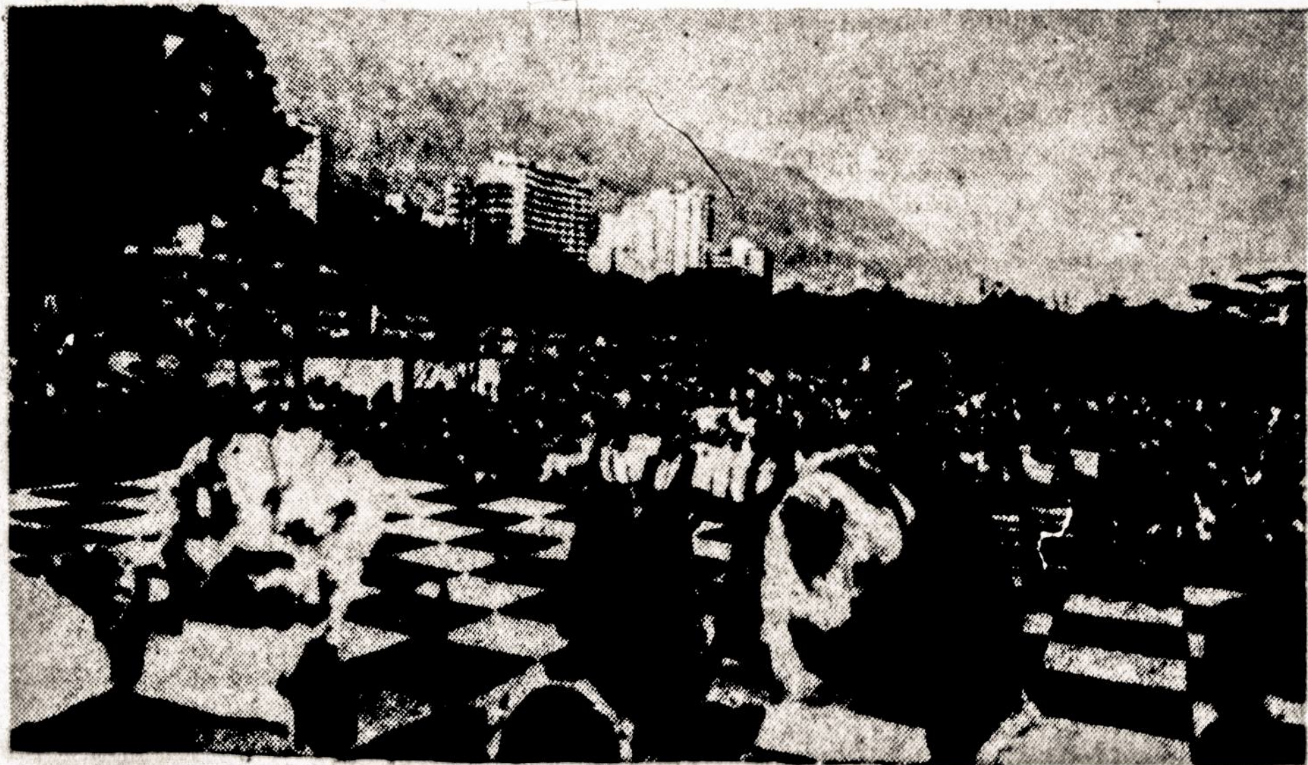
Chattanooga, Tennessee, 1937. Lietuvių susirinkimas.