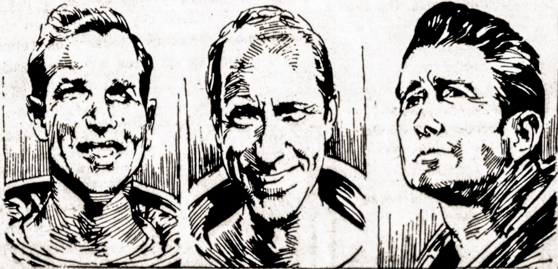
Ketvirtas skridimas į mėnulį liepos 26 dieną prasidėjo gerai ir pirmos žinios sako, kad kelionė vyksta sėkmingai. Vaizde Apollo 15 astronautai: (iš kairės) David R. Scott, Alfred M. Worden ir James B. Irwin.

Nuo pradžios šių metų viso . . . $ 63,104.00