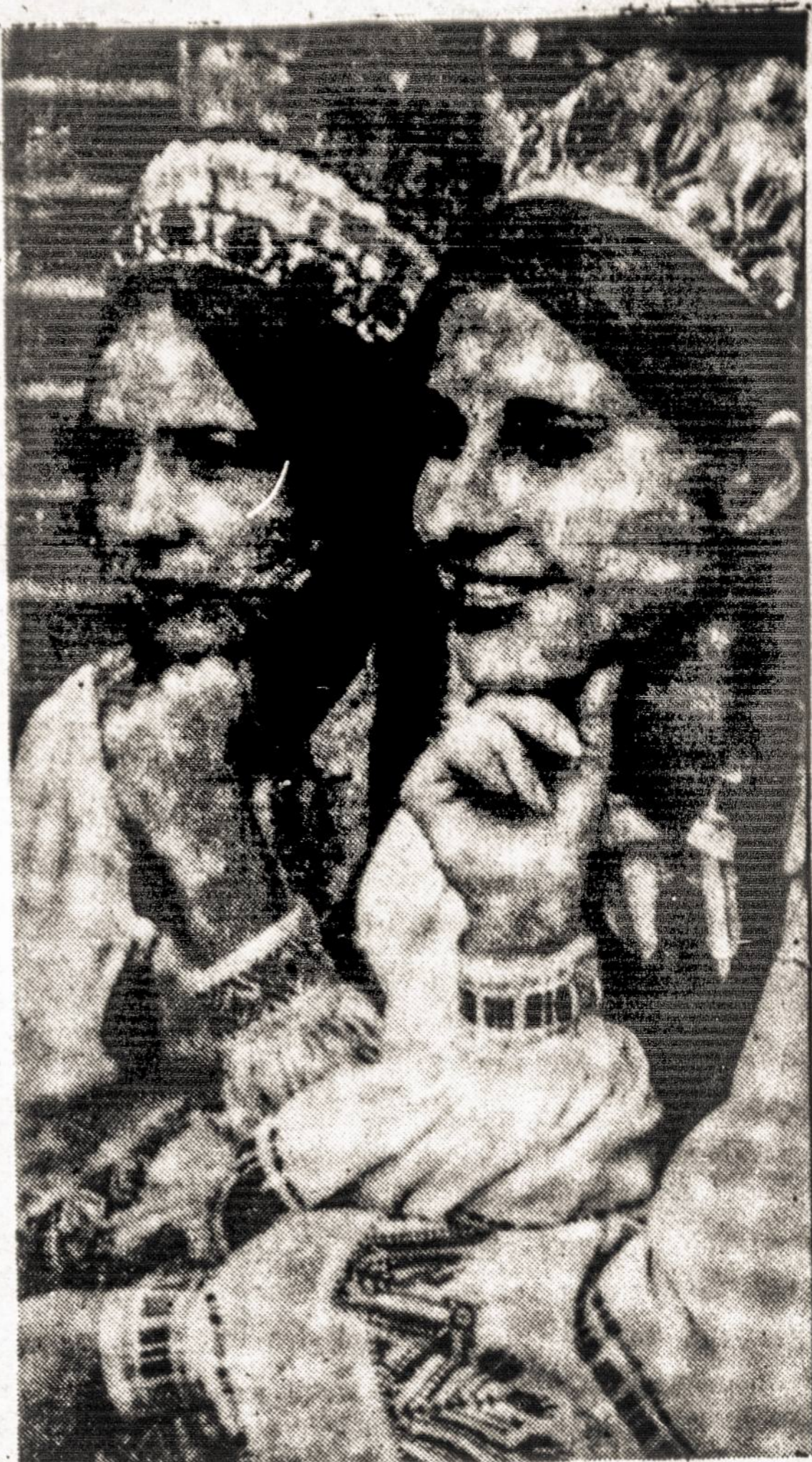
Toronto mieste įvykusiam tautų karavane dalyvavo ir lietuviai. Vaizde matome dvi lietuvaites tautiniais drabužiais, kurios dalyvavo šokiuose.

Ohio valstijos universiteto mokslininkų geologų grupė 350 mylių nuo Pietų ašigalio uolienose aptiko gerai išsilaikiusį senovės gyvūno, gyvusio prieš 200 mln. metų, skeletą. Tai buvęs nedidelis keturkojis žinduolis. Tose pačiose uolienose surinkta visa suak-