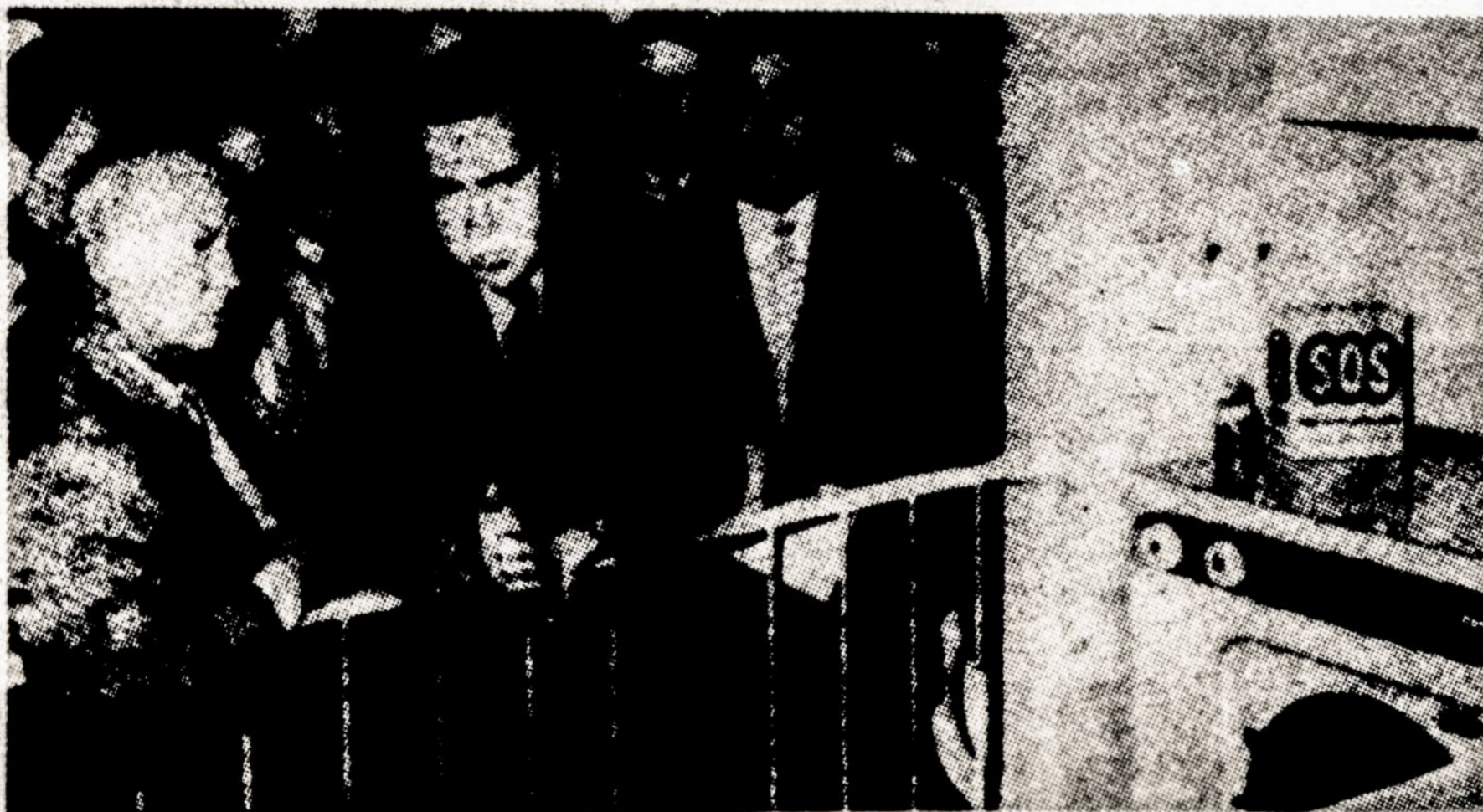
Nikita Chruščevs (kairėje) pagarsėjusio disputo amerikoniškoje pavyzdinėje virtuveje metu Maskvoje, pasaulinėje parodoje, nesilaikydamas mandagumo, kai jis puolė Richardą Nixoną, tada buvusį JAV viceprezidentą.