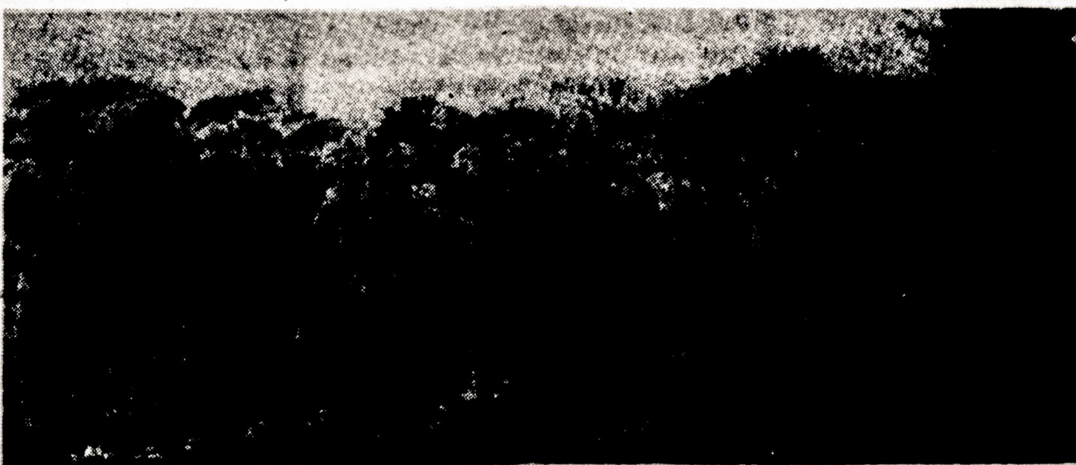
Chicagos lituanistinių mokyklų jaunimas, susirinkęs sporto žaidynėms.

Nuo pradžios šių metų viso.....$ 12,290.56