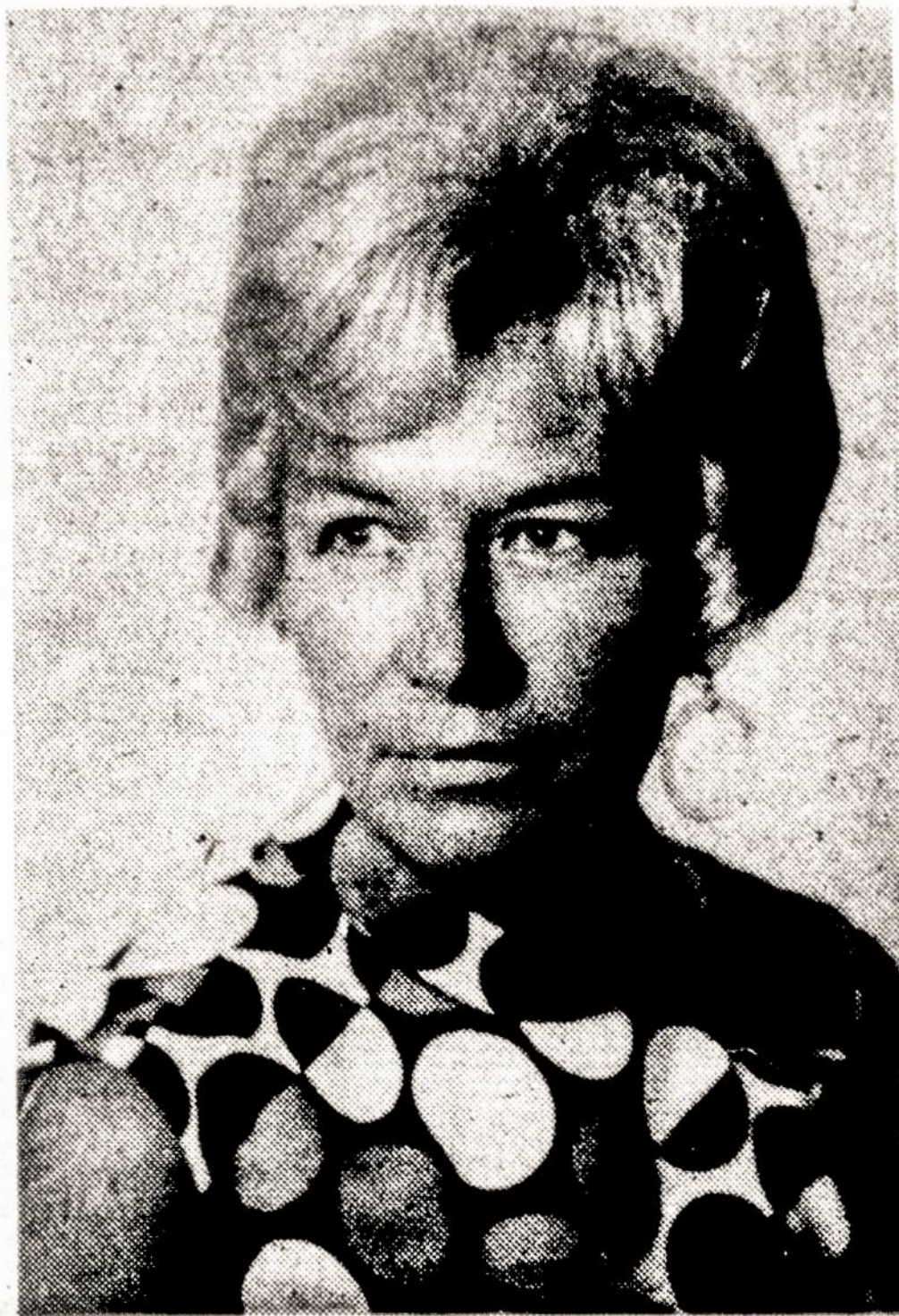
NAUJI SLA NARIAI