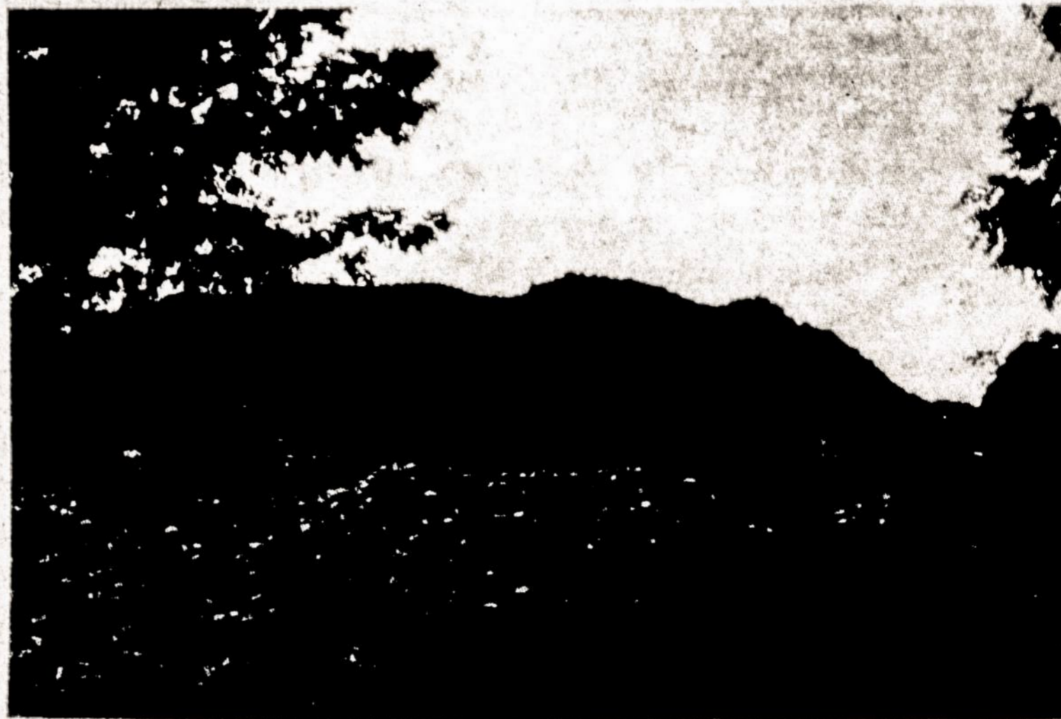
Gimtinė Gedimino pils šiandieną