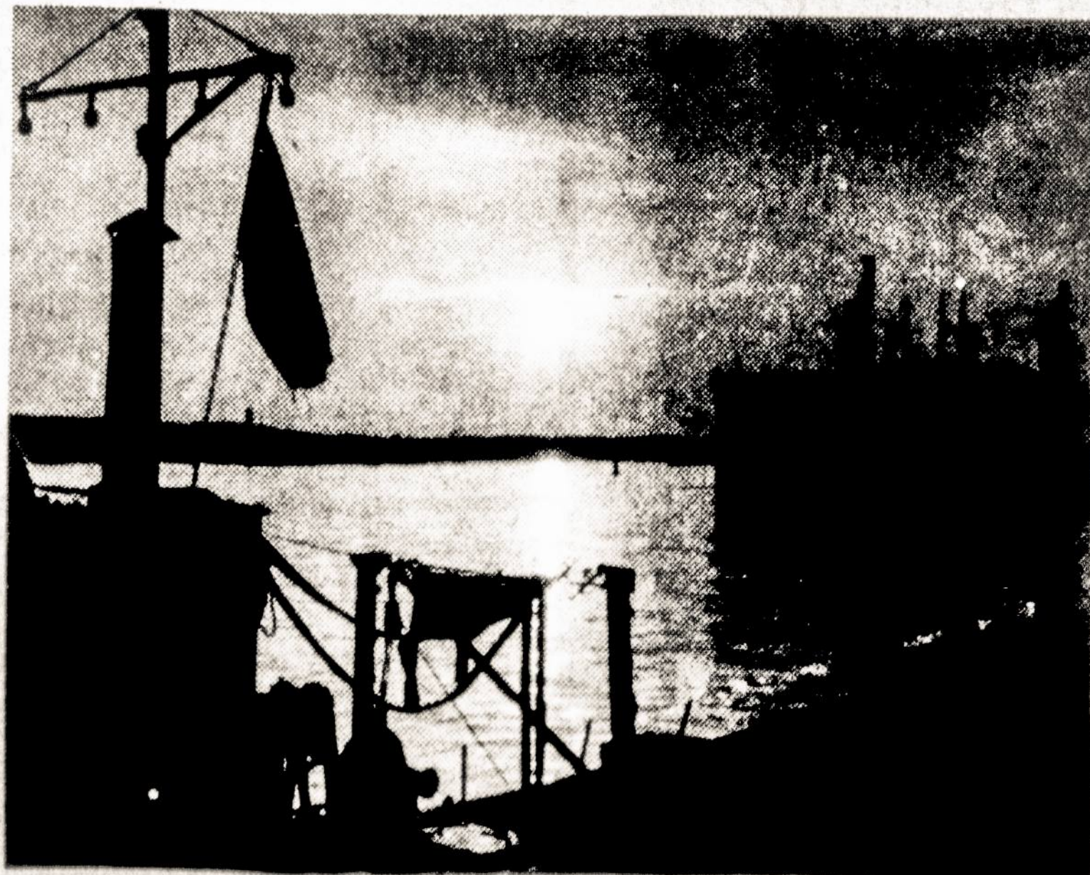
A view of Klaipėda - Lithuania's Seaport on the Baltic.

UZ 11 sav. 6 d.: V I S O . . . . . $13,170.49