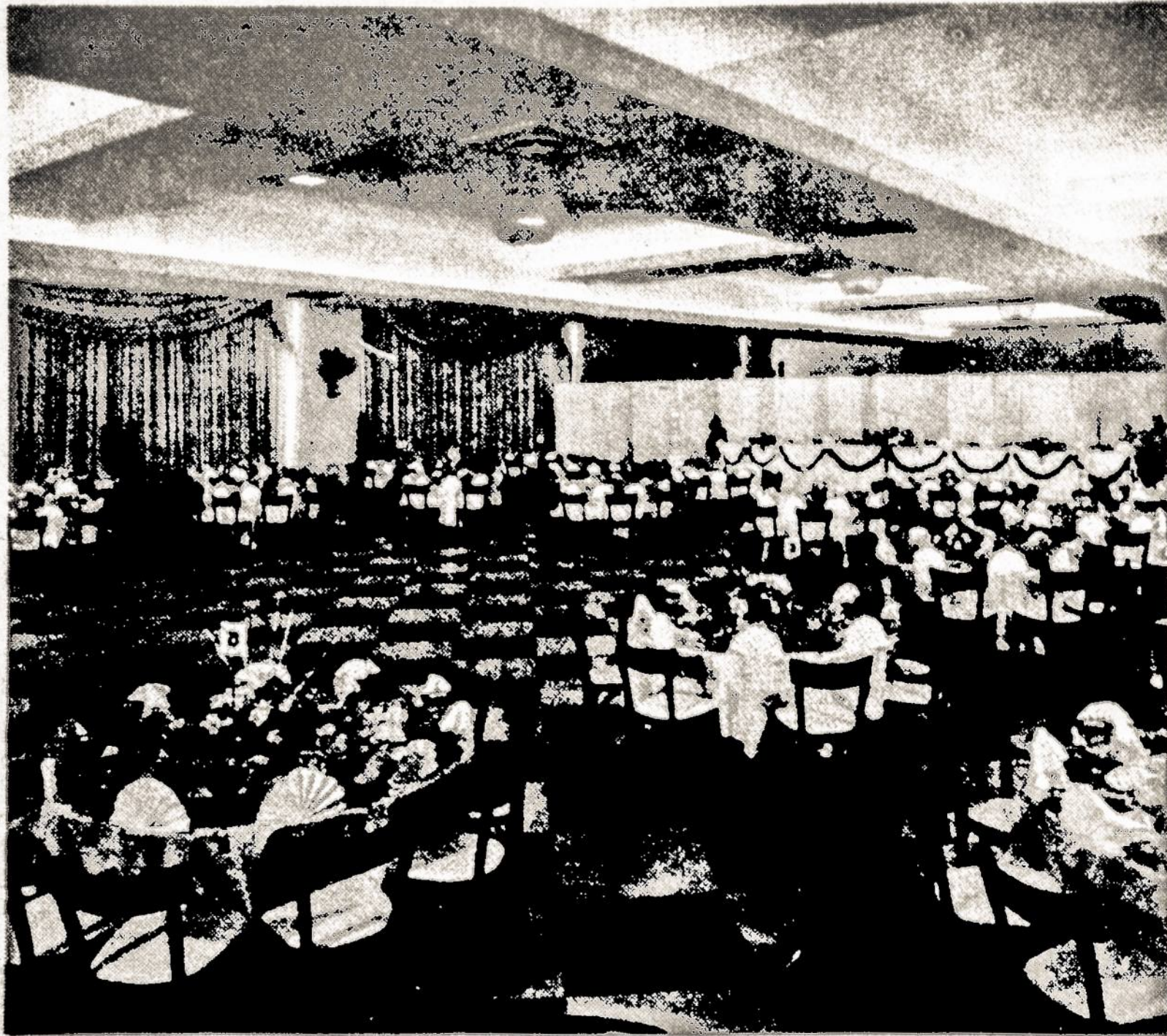
Lido Hotel Ballroom where the SLA Convention will be held.

The June 26-30 period, was chosen for the convention because it is past the frenzied tourist season and just before the hectic Fourth of July goings-on. In the latter part of June the weather is still mild and there is no danger of storms and rain. Reminder: now is the time to plan your 1972 vacation period and pick convention delegates.