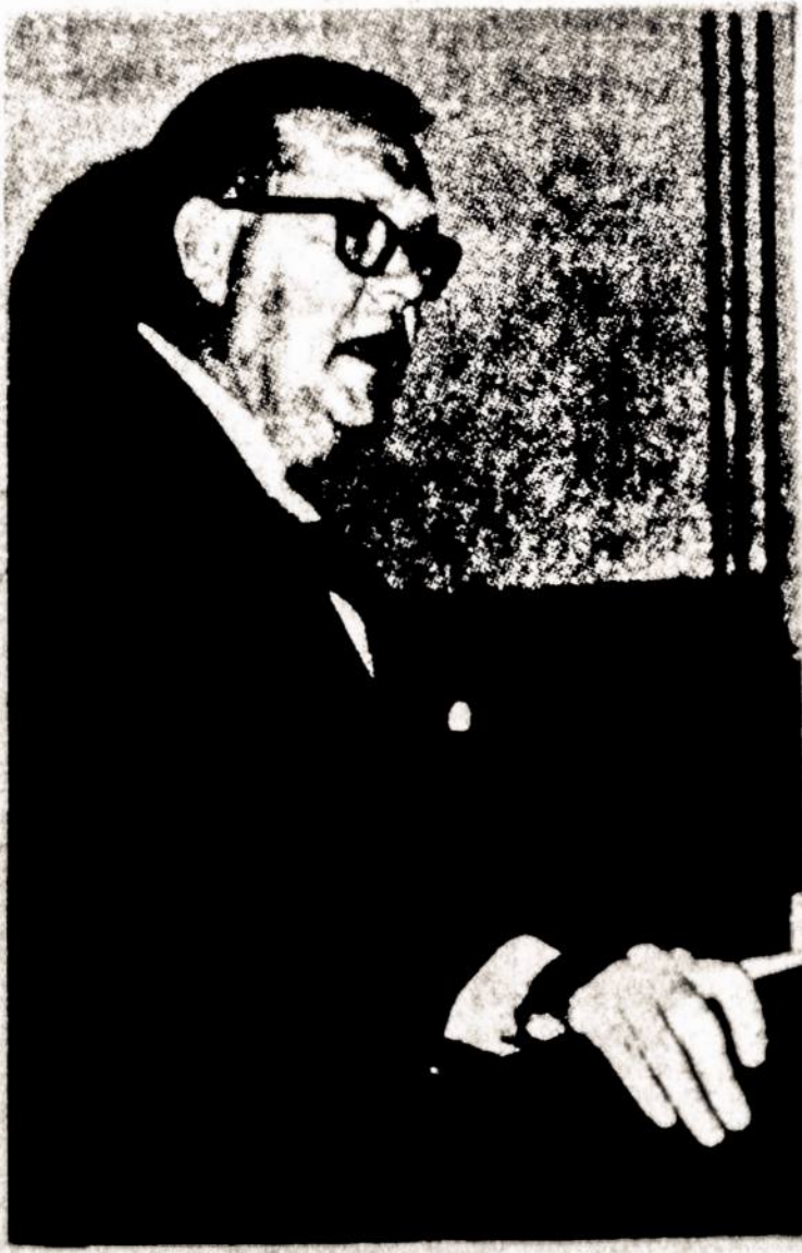
Kongresmanas Edward Derwinski, kuris Jungtinių Tautų Žmogaus Teisių komisijoj iškėlė Baltijos tautų skaudų likimą ir tuo būdu atkreipė pasaulio dėmesį į padarytas šioms tautoms skriaudas.

GRUODŽIO MĖNUO SKIRTAS SLA PILDAMOSIOS TARYBOS NOMINACIJOM. KIEKVIENA SLA KUOPA GRUODŽIO-DECEMBER MĖNESYJE ŠAUKIA VISUOTINĄ NARIŲ SUSIRINKIMĄ IR PRISI LAIKYDAMA NURODYTŲ TAI SYKLIŲ ATLIEKA NOMINACIJAS Į SLA PILDOMĄJĄ TARYBĄ. ČIA YRA VIENA SVARBIŲJŲ SLA KUOPŲ. JŲ VEIKĖJŲ PAREIGŲ.