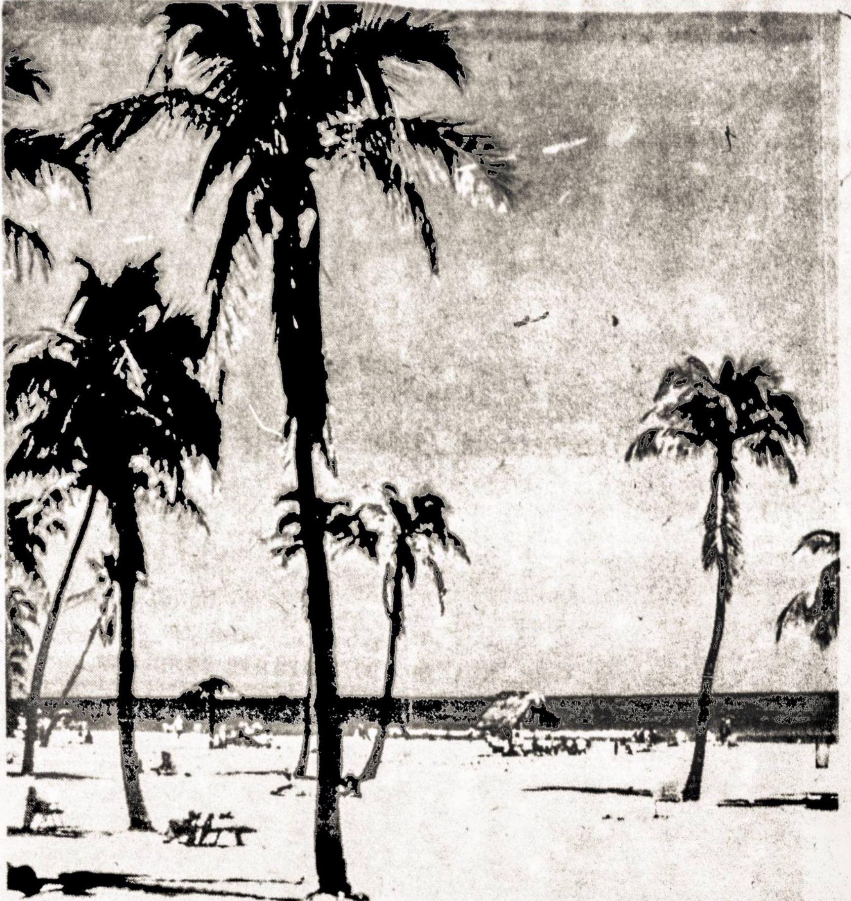
SWIM YEAR 'ROUND

This maintains what always is one of the first impressions a stranger received in Miami Beach - the sparkling cleanliness of the city. Smoke, smog and dust are pleasingly absent, as also are most of the pollens that cause hay fever. Many people come here in summer to escape the latter.