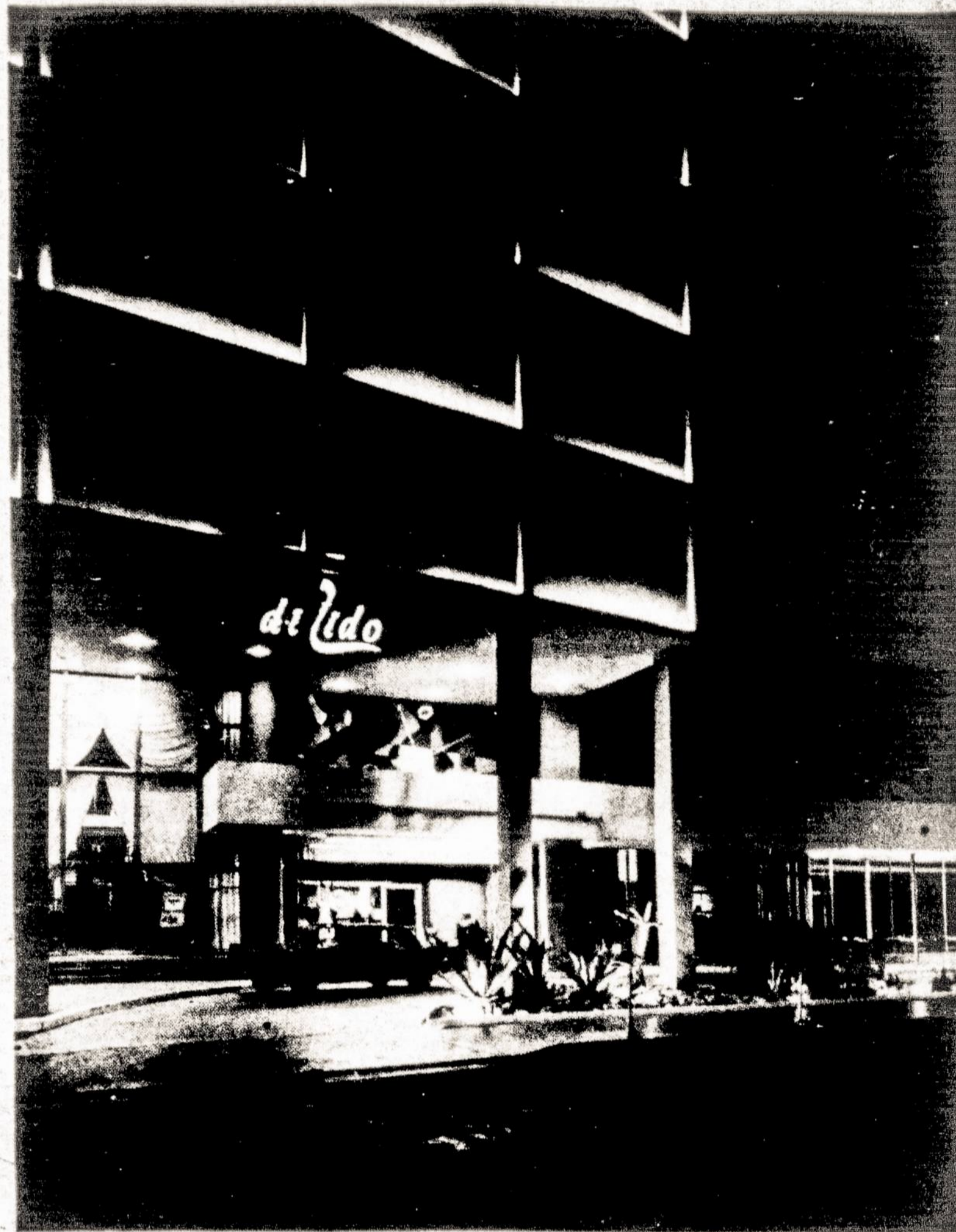
DI LIDO VIEŠBUTIS KURIAME POSĖDŽIAUSIME

Kas turės daugiau šios vasaros laisvų dienų, turės gerą automobilį ir bendrai turi pomėgį gražiems gamtovaizdžiams pakeliui į ( Pabaiga 2 puslapy )