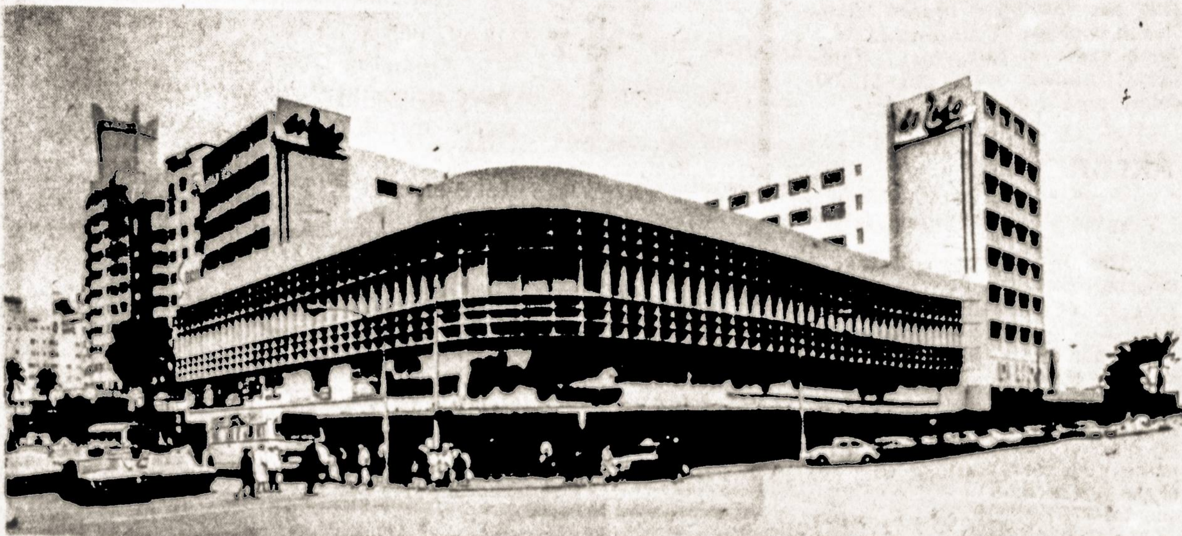
TEVYNE, January 21, 1972

"After sundown - for dining and dancing - women wear casual street clothes, cocktail dresses and evening gowns - in about even proportions. Men wear regular suits, dark dinner jackets or summer dinner jackets of light hues."