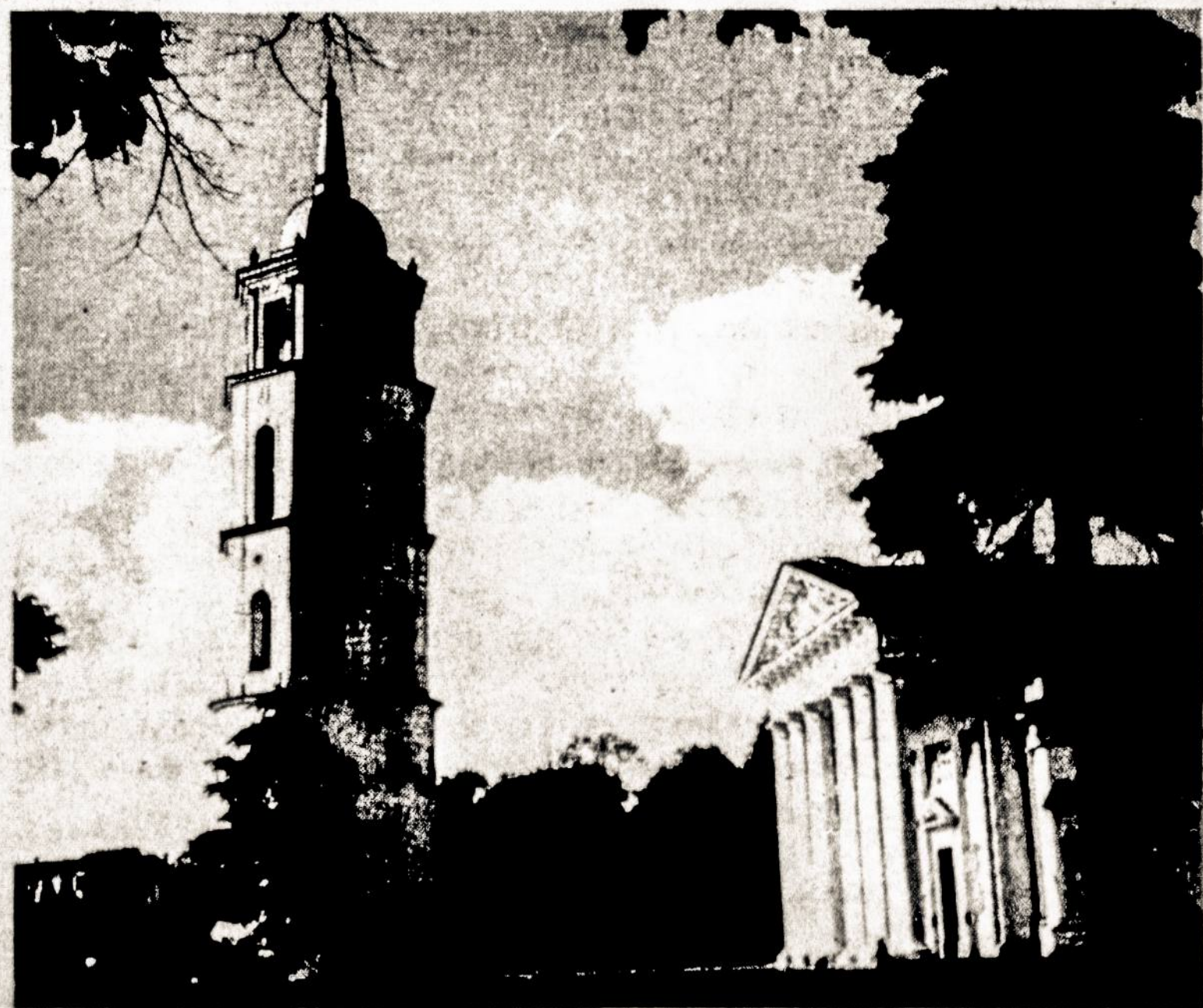
Bell Tower and Cathedral (now Picture Gallery) on Gediminas Square in Vilnius.

Because of the threatening Spring floods, the architect bordered the cathedral's foundation with huge underground drain canals, stored up many underground openings, insulated various crypts and underground rooms.