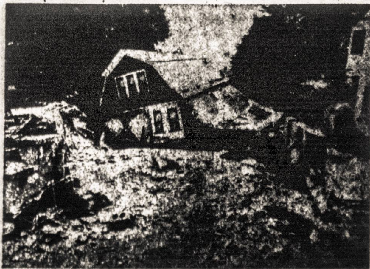
Photo above shows one of thousands of houses across the Wyoming Valley in Pennsylvania, destroyed by the floods in the latter part of June. Among the thousands left homeless are hundreds of Lithuanian families, many of them members of the Lithuanian Alliance of America. The SLA Board of Directors have contacted various institutions for relief to the unfortunate people. The President of the United States designated three billion dollars Federal Aid.