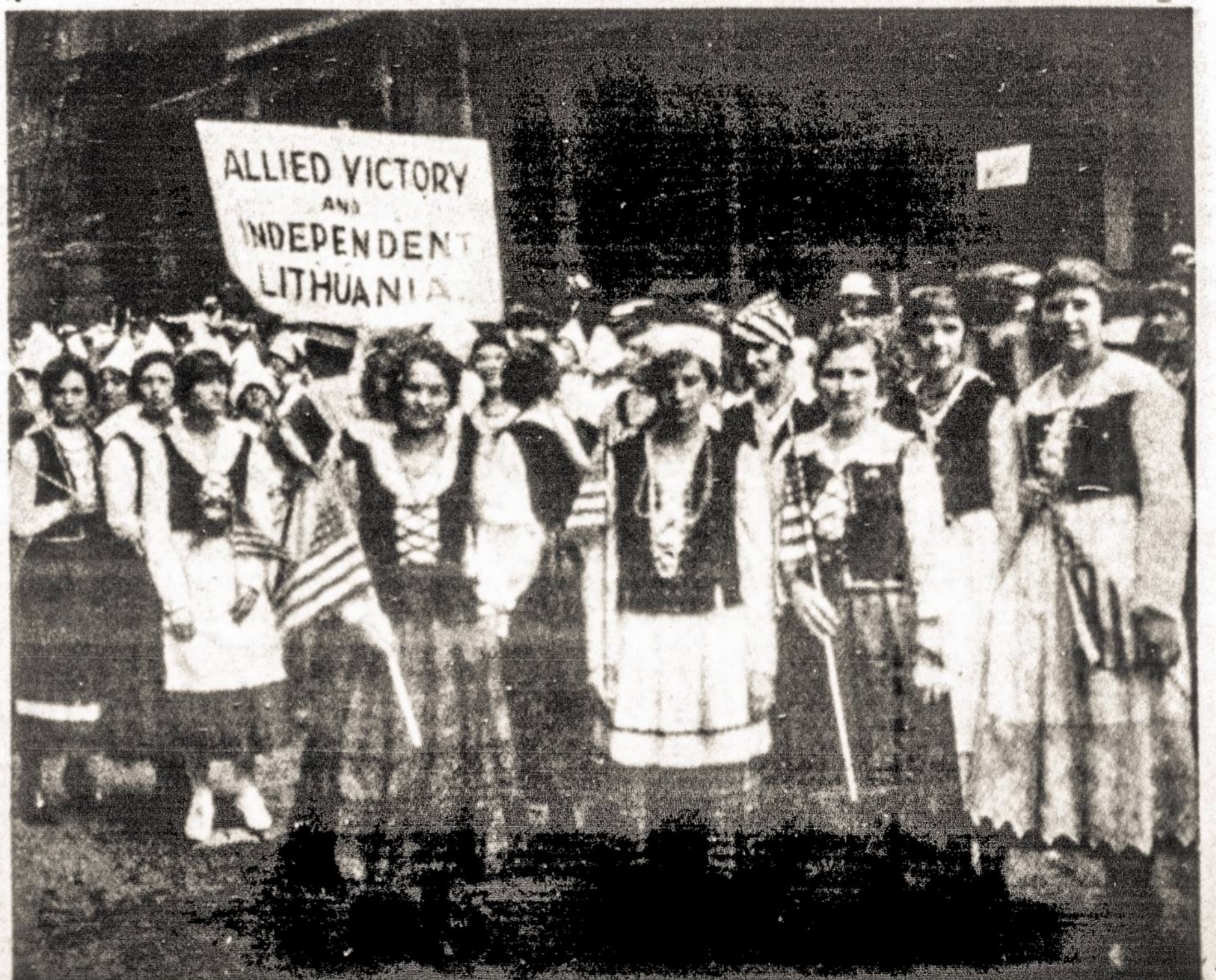
Tai demonstracijos, vykusios ne dabar Bostone, bet prieš 50 metų New Yorke.