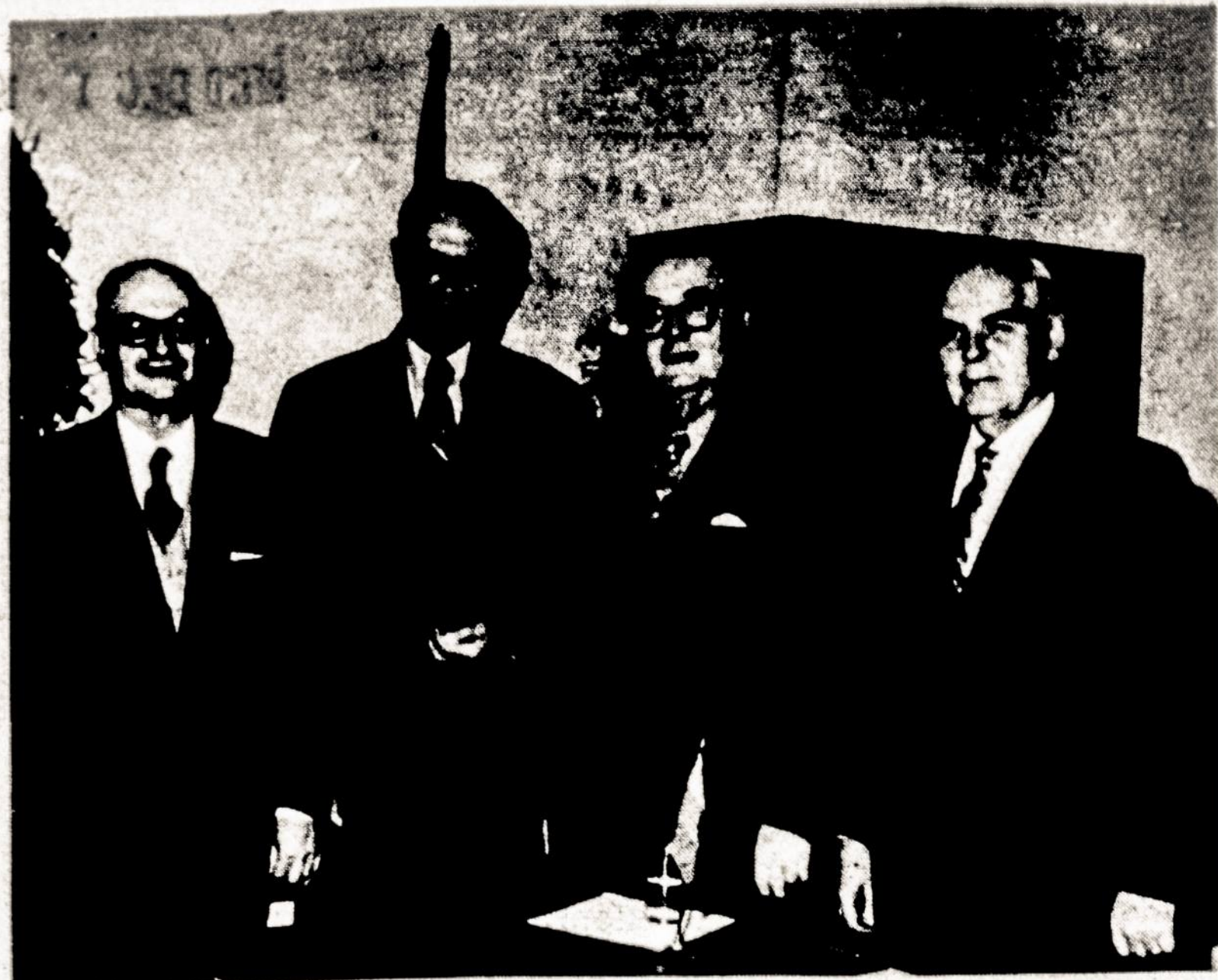
PAGERBTI UŽ NUOPELNUŠ SUSIVIENIJIMUI

Keičiant adresą, būtina pranešti senasis adresas. Už skelbimų turinį redakcija neatsako.