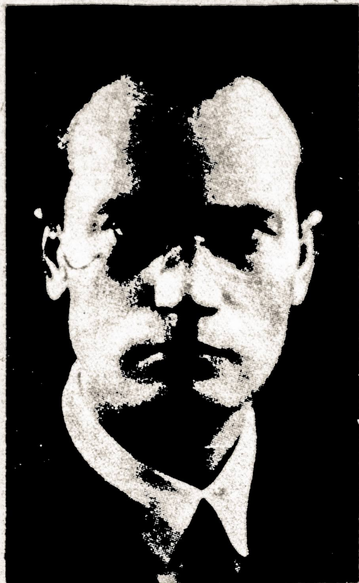
Vincas Mykolaitis - Putinas, Lietuvos rašytojas 1973 m. sausio 6 būtų jau 80 metų.

"Ligos turi būti tyrinėjamos ir studijuojamos mokslininkų - ne laboratorijose po mikroskopais, bet maisto gamybos centruose - tada bus galima rasti priemones nuo ligų apsisaugoti. Pirmiausia - būtina surasti tas ligas sukeliančiasias priežastis, o tada bus lengva tas ligas ir pašalinti. Tas pats yra ir su vėžiu, širdies ir dantų ligomis. Kol nebus surastos pradinės priežastys, sukeliančios tas ligas, niekas jomis sergančių žmonių nepagydysi!"