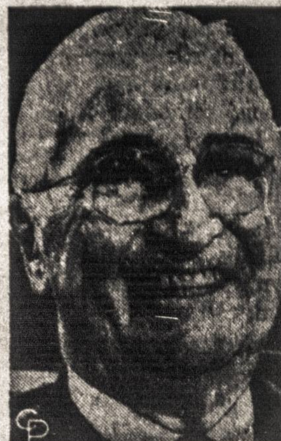
Harry S. Truman

Prezidentas Harry Truman, miręs eidamas 88-erius metus, istorijoje bus atžymėtas kaip vienas daugiausiai pasižymėjusių-atlikusių darbų JAV Prezidentų! Jį prisimins visas civilizotasis pasaulis, daugiausiai už jo nuopelnus vykdant "TRUMAN DOCTRINE", kurios dėka nuo BOLŠEVIKŲ invazijos išgelbėtos Graikija ir Turkija. Jo nuopelnams priskaitomas, taip vadinamas, ir "MARSHALL PLAN", kurio pagalba ekonominei buvo atstatyta karo sugriautoji Europa. Be ne ryškiausiai pasaulis, ypač Europa, jį prisimins - už sukūrimą NATO, kuris sustabdė telimesnius Stalino užgrobinus Europoje.