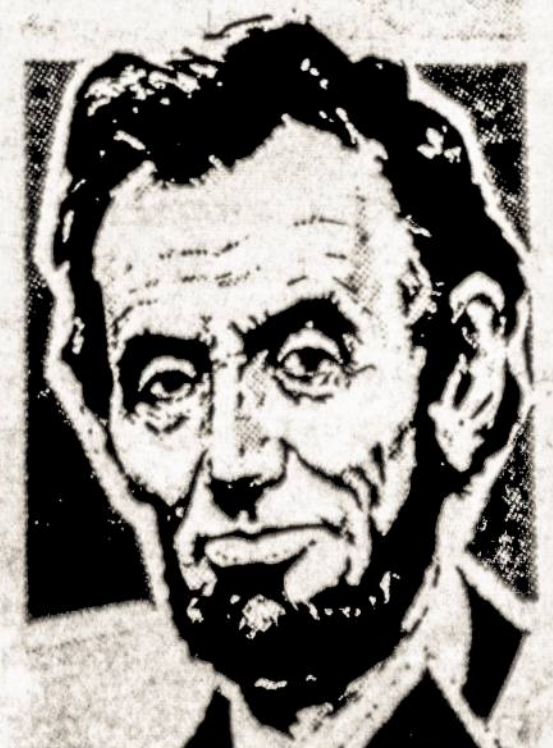
Vasario mėn. minėjome ir to didžiojo už žmonijos laisvę kovotojo Abrahamo Lincoln gimtadienį

Eilė šeiminių paremė seniausią radio programą Naujoj Anglijoj 39 metų sukakties proga, iškepdamos savo gaminių.