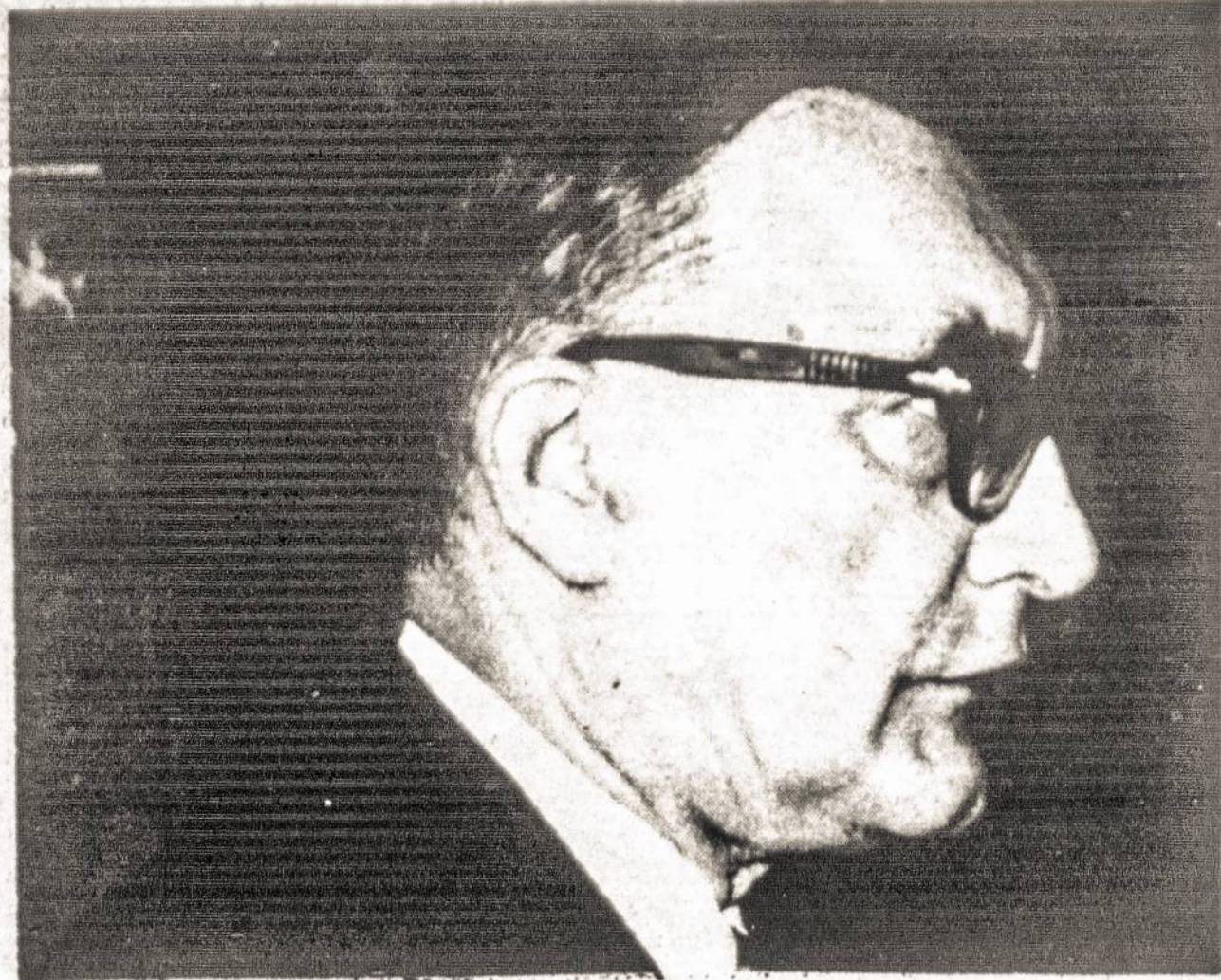
Rašo STASYS LOZORAITIS, Lietuvos Diplomatinijos šefas

Keičiant adresą burina pranešti senasis adresas. Už skelbimų turinį redakcija neatsako.