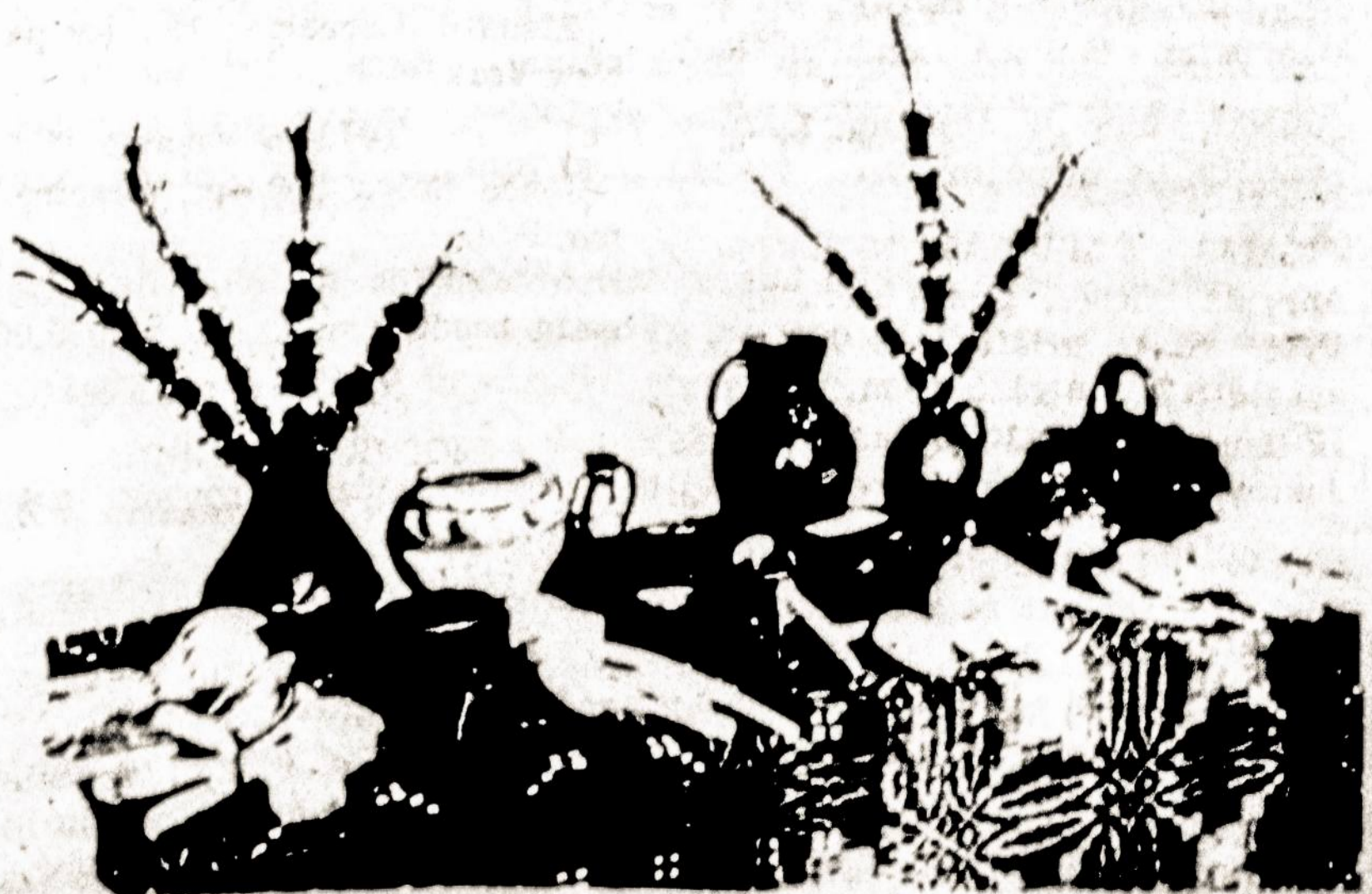
Velykinės verbos Lietuvoje