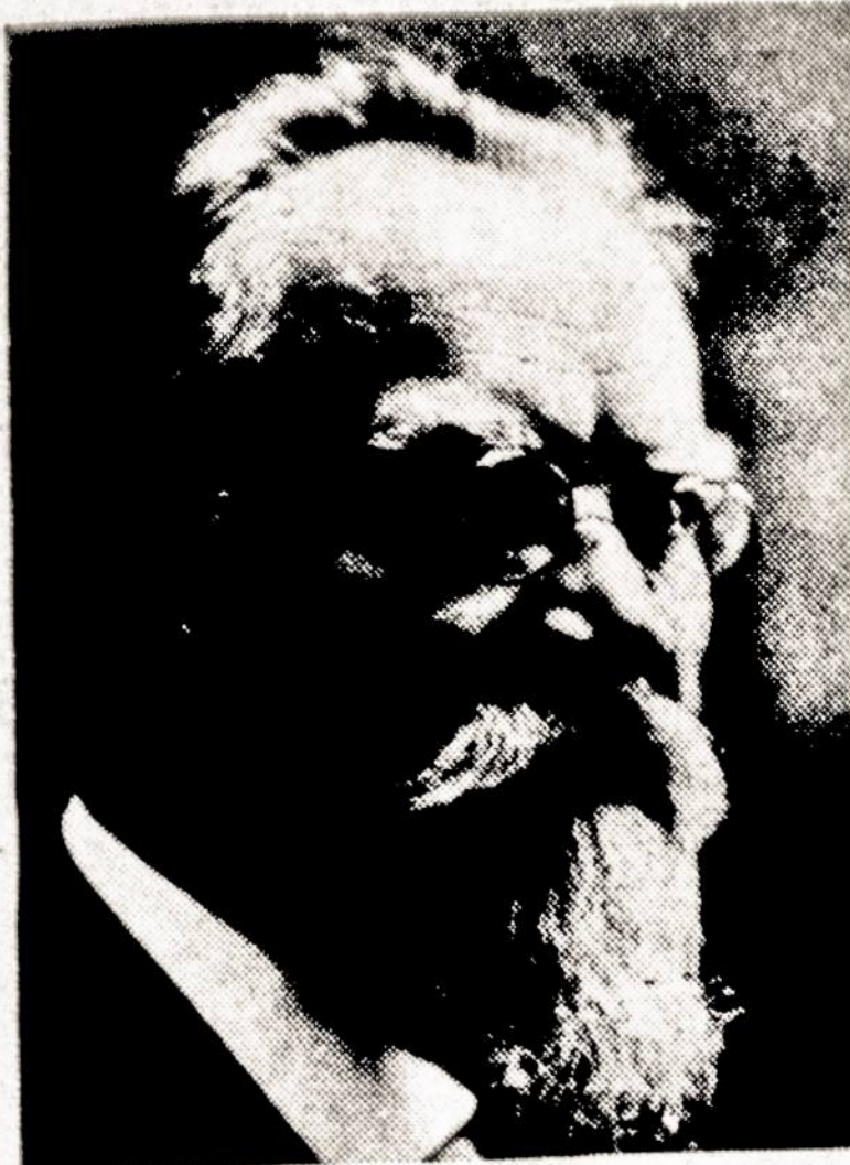
DR. JONAS ŠLIUPAS