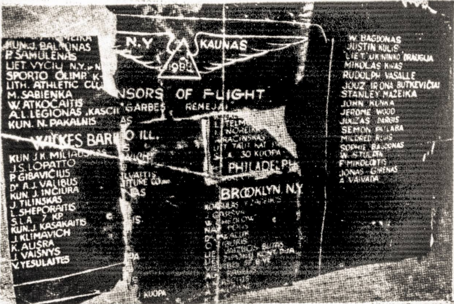
Lituanicos lėktuvo šonas su skridimo rėmėjų vardais - Kauno muziejuje.

Taip gerai lietuviams pažįstama mūsų transatlantinių didvyrių nuotrauka!